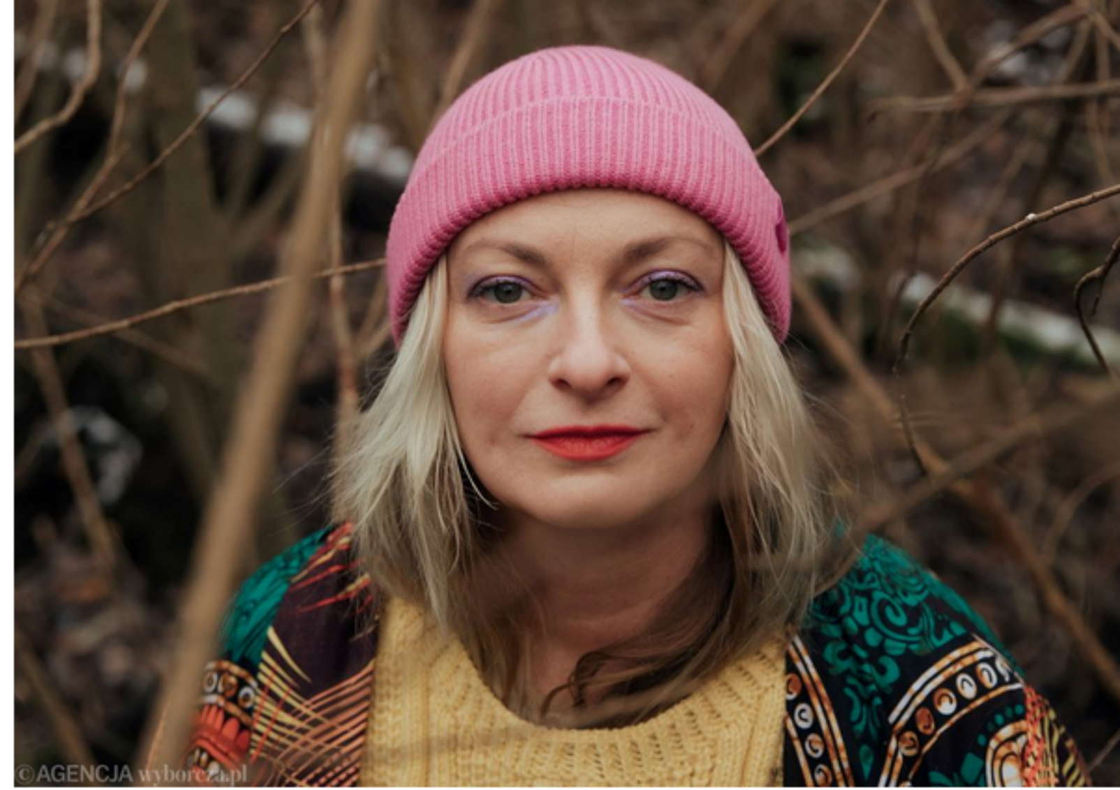
• Monika Strzępka