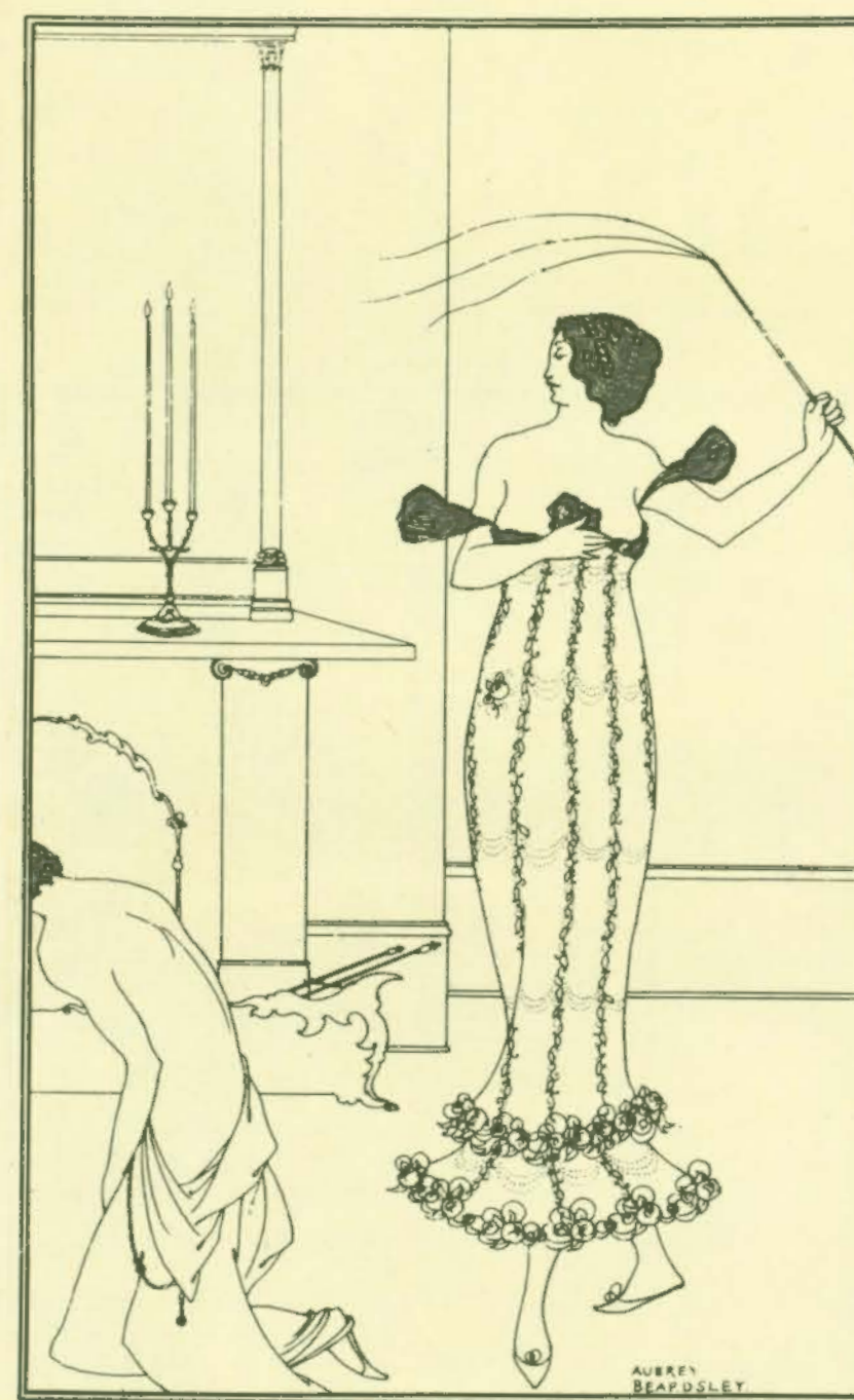
W programie wykorzystano rysunki Aubreya Beardsleya

Organizacja widowni przyjmuje zamówienia na bilety indywidualne i zbiorowe, prowadzi sprzedaż biletów, tel. 43-71-01, 44-27-66