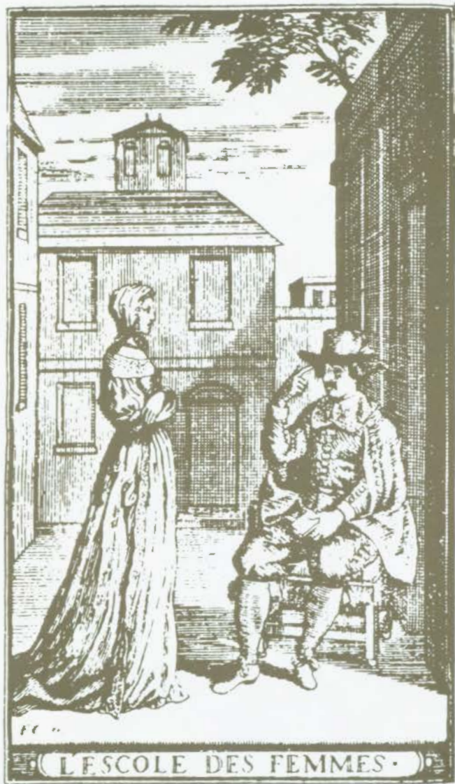
■ MOLIER I PANNA DE BRIE W SZKOLE ZON (ARNOLF I ANUSIA) WG F. CHAUVÉAU

W życiu artysty zastawia siła nienawści nieustannie go ścigającej. Jesteśmy dziś skłonni wrzucać się losom tego człowieka, który dał dowód takiej odwagi i szlachetności w stosunku do swych aktorów i który umarł na scenie. Molière stał się "świętym Moliérem". Człowiek sam warr był jednak więcej niż ta sulpicjańska adoracja, a jeżeli jego teatr tak bogaty jest w głęboke obserwacje nad naturą ludzką, to dlatego, że jego własna dusza była teatrem gwałtownych walk między sprzecznymi uczuciami i pragnieniami. Jego myśli i czyny nie zawsze są piękne i wielkie, lecz wielki i piękny jest nieustanny wysiłek, aby przewyższyć samego siebie.