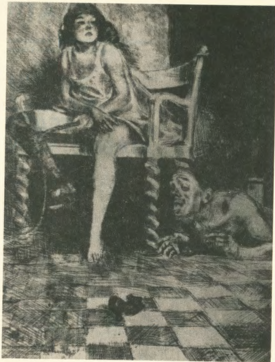
„BESTIE”, KSIĘGA BAŁWOCHWALCZA

Kobiety są smukłe i wysokie, mężczyźni są mali; wydaje się, że mogą tylko podglądać (...), że muszą się wspinać na palce, żeby tym kobietom zajrzeć w oczy (...). Mali, czarni mężczyźni o wielkich głowach chorych na puchlinę wpatrzeni są w pantofelki albo w maleńkie stopy olbrzymek, które (...) podnoszą nogi w czarnych pończochach zbyt dla nich wysoko.