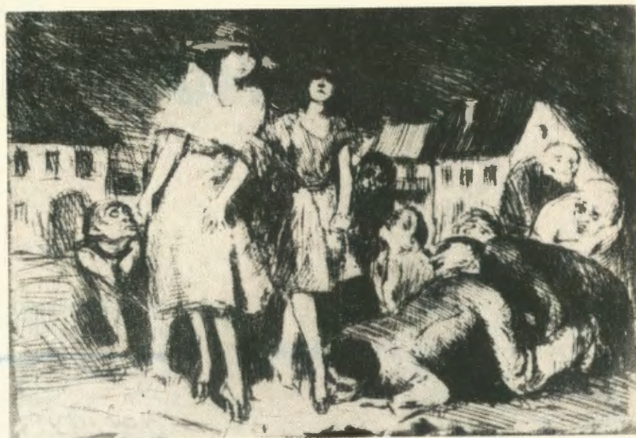
„ZACZAROWANE MIASTO I”, KSIĘGA BAŁWOCHWALCZA

Atmosfera dziwnej błahości przenika tę całą scenerię. Tłum płynie monotonnie i rzecz dziwna, widzi się go zawsze jakby niewyraźnie, figury przepływają w splątanych, łagodnym zgiełku, nie dochodząc do zupełnej wyrazistości. Czasem tylko wyławiamy z tego gwaru wielu głów jakieś