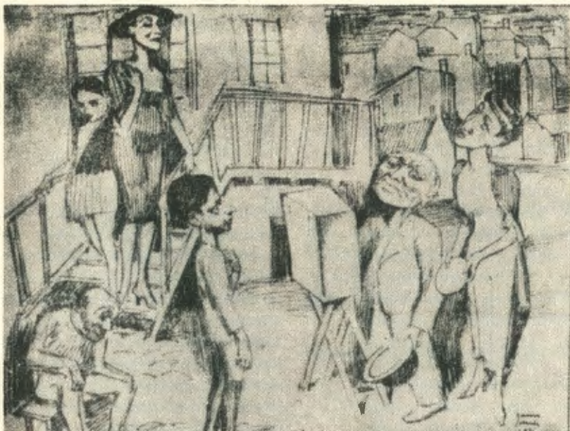
KATARYNIARZ, RYSUNEK TUSZEM, 1935

Po południu, bywało, wiatr się uci-chał, Adela czyściła na ganku wielkie miedziane rondle chrzęszczące metalicznie pod jej dotknięciem. Niebo stawało nad gontowymi dachami nieruchomo, zatchnione, rozgałęzione niebieskimi drogami. Subiekci przysłani ze sklepu z jakimś zleceniem