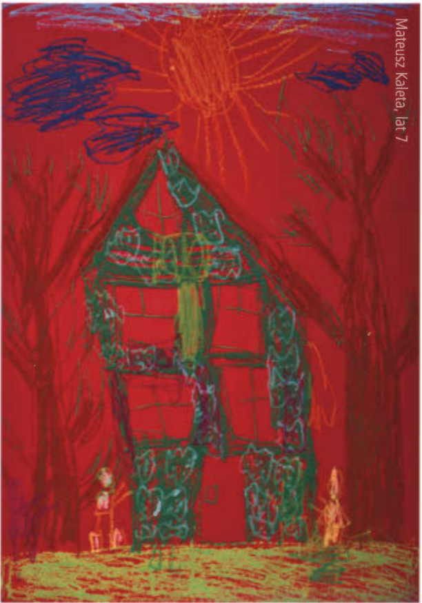
Mateusz Kaleta, lat 7