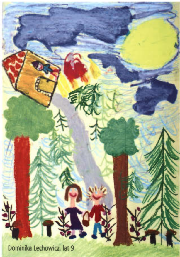
Dominika Lechowicz, lat 9