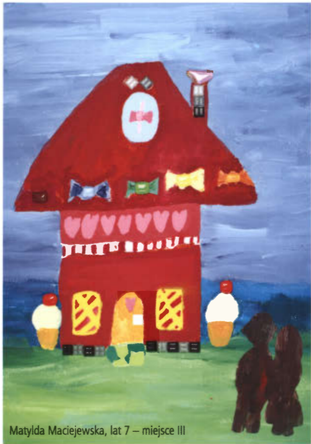
Matylda Maciejewska, lat 7 – miejsce III