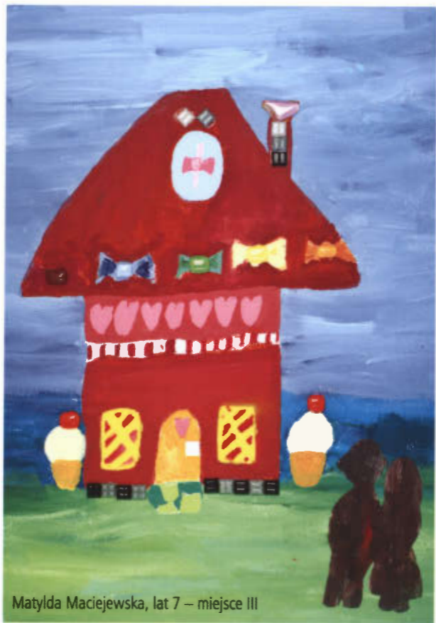
Matylda Maciejewska, lat 7 – miejsce III