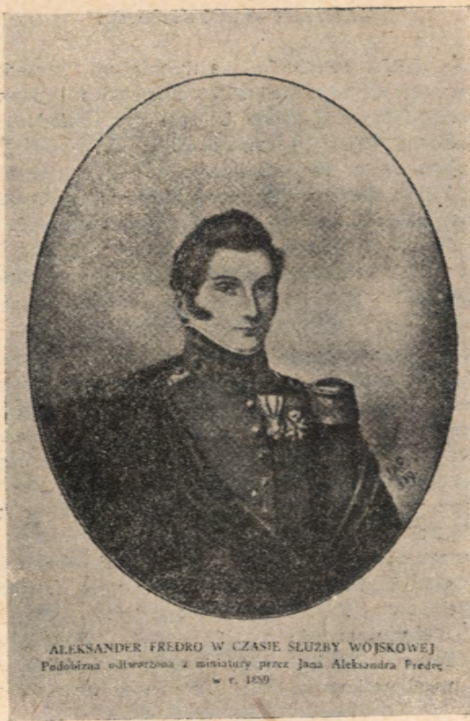
ALEKSANDER FREDRO W CZASIE SŁUŻBY WOJSKOWEJ Podobizna odtworzona z miniatury przez Jazca Aleksandra Fredro w r. 1859