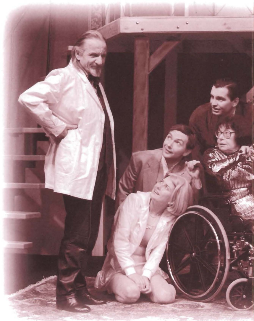
Reżyser z aktorami na próbie