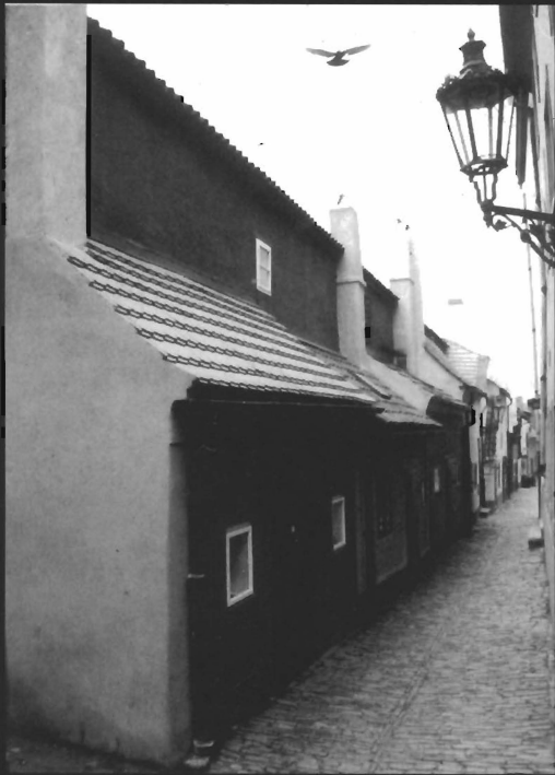
Złota uliczka, Praga