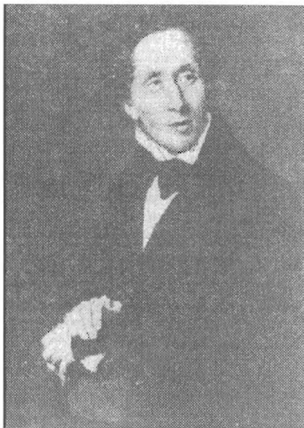
H.Ch.Andersen. Portret pędzla C. A. Jensena. 1836 rok.

Ucieczką od rzeczywistości w świat złudzeń i baśni, była twórczość HANSA CHRISTIANA ANDERSENA, najbardziej znanego i popularnego w świecie duńskiego pisarza XIX wieku. Urodził się w Odense w rodzinie praczki i szewca, wykształcenie miał niewielkie, już od wczesnych lat pragnął zostać aktorem, lecz niekorzystne warunki fizyczne nie pozwoliły mu zrealizować tych marzeń. Mając 14 lat udał się do Kopenhagi, gdzie znalazł możnych protektorów. Dzięki nim skończył szkołę i odbył kilka podróży za granicę; był we Włoszech, w Anglii, Turcji, zwiedził Hiszpanię, Francję i Niemcy. Wrażenia z tych podróży utrwalił w licznych opisach.