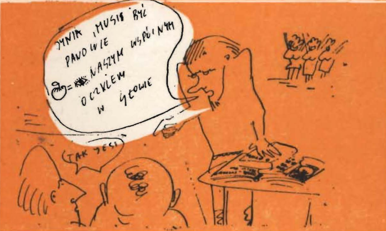
D. Z. 3639/74 — S-70(30338) — 4000