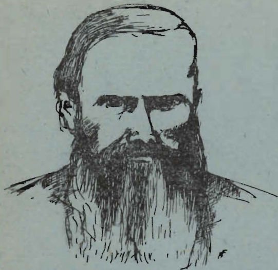
FIODOR MICHAJŁOWICZ DOSTOJEWSKI