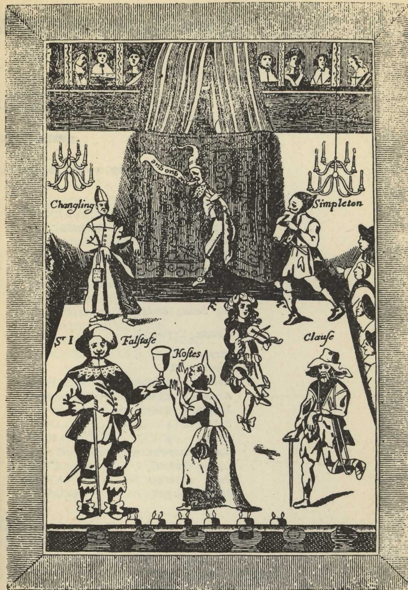
Teatr Pod Czerwonym Bykiem w Londynie sztych z 1672 r.