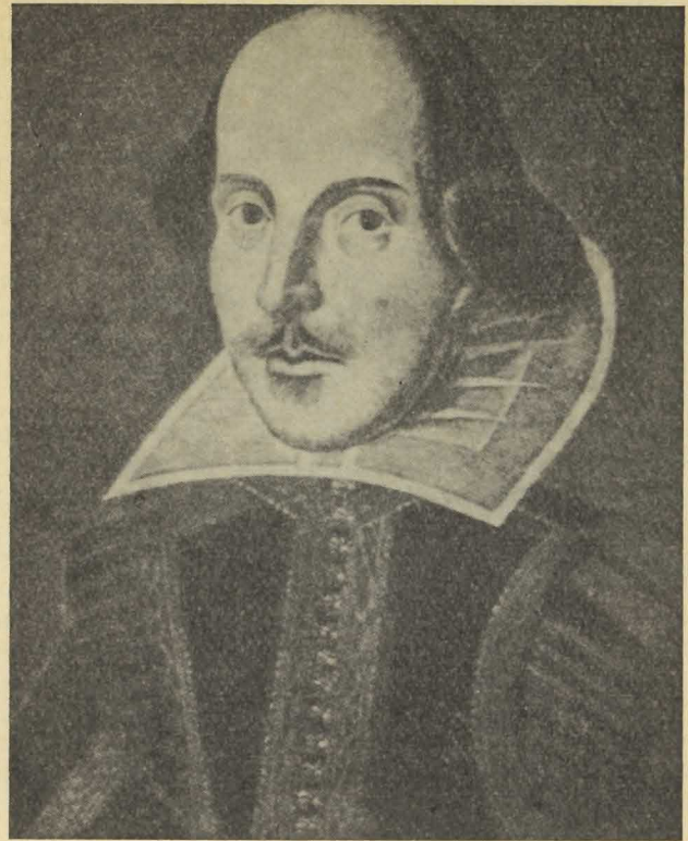
WILLIAM SHAKESPEARE 1564—1616

Poeta, aktor, największy pisarz dramatyczny świata. Urodził się w miasteczku Stratford nad Avonem. Karierę teatralną rozpoczyna w Londynie w teatrze znanego tragika Burbadge'a, a następnie w kompaniach aktorskich „Sług lorda Szambelana” i „Sług Królewskich” jako aktor, przedsiębiorca i dostawca sztuk teatralnych.