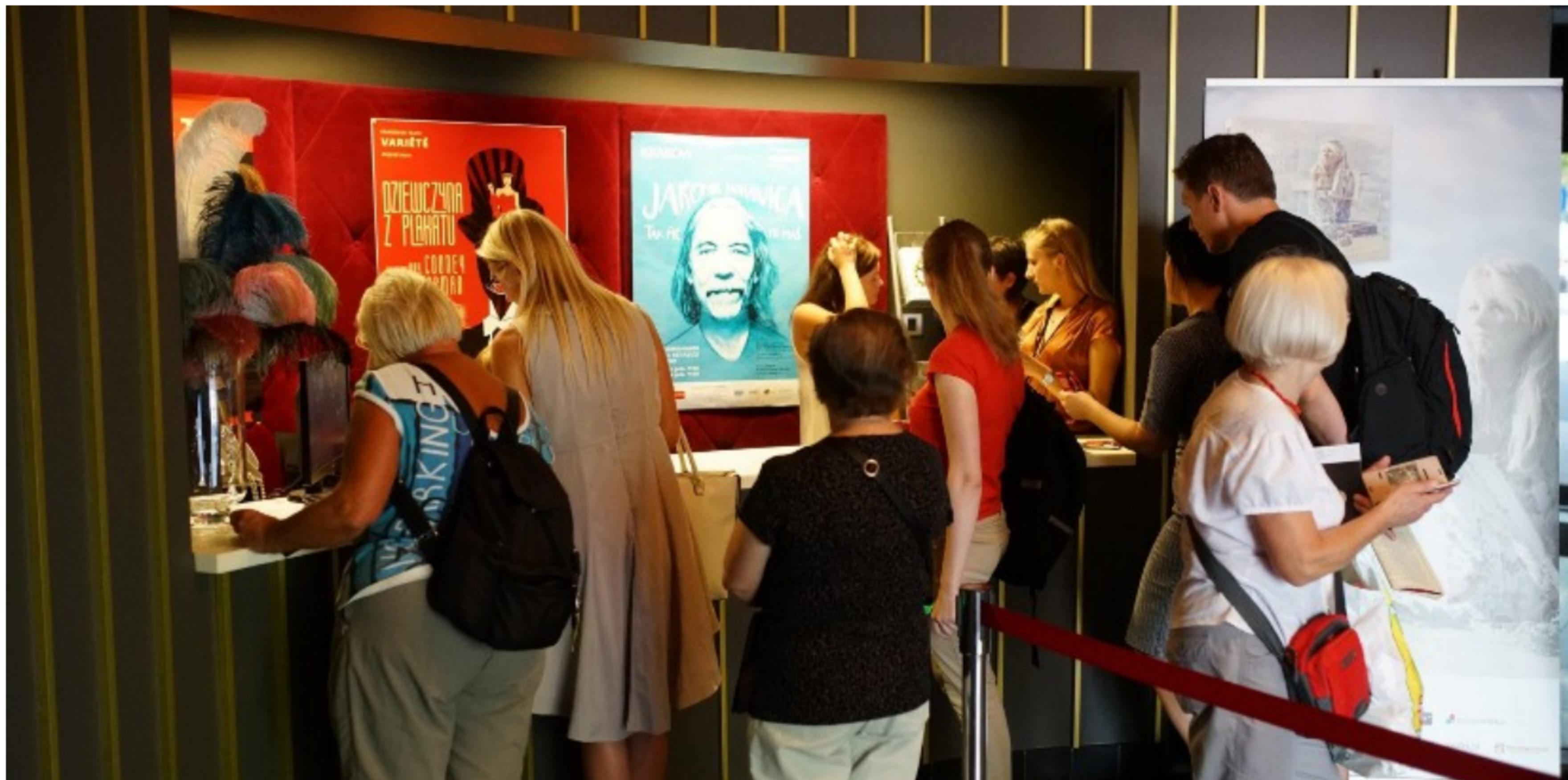
Ceny biletów w kinach wzrosły już o 2 złote, w teatrach różnica wyniesie średnio 10 zł.