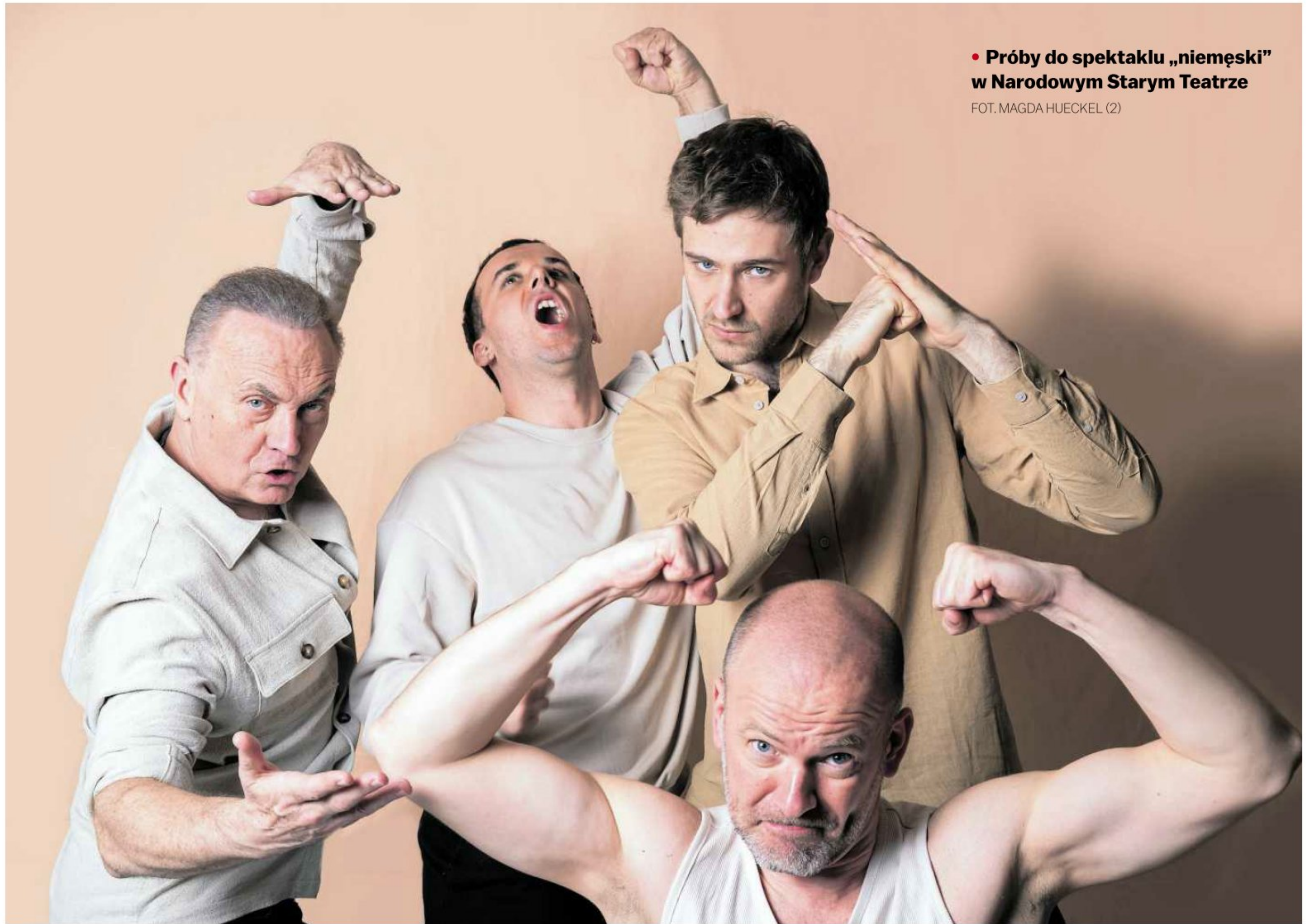
• Próby do spektaklu „niemęski” w Narodowym Starym Teatrze