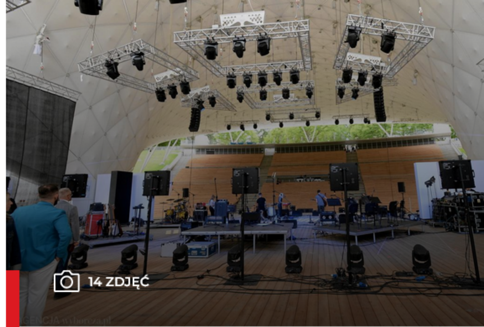
Projektanci Flanagan Lawrence podczas wizyty w Teatrze Letnim w Szczecinie

TEATR LETNI W SZCZECINIE 29.07.2022, 18:07