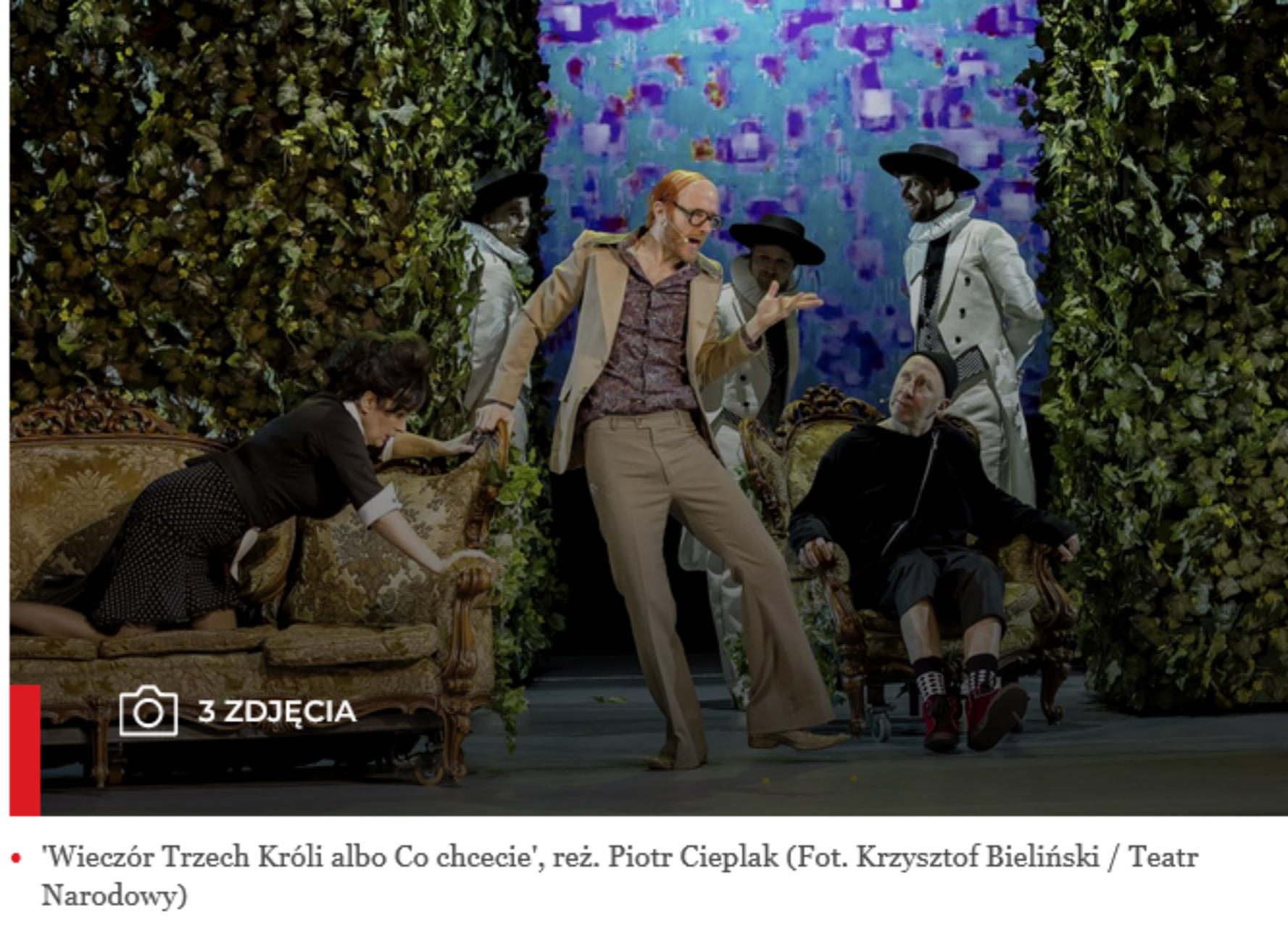
• 'Wieczór Trzech Króli albo Co chcecie', reż. Piotr Cieplak