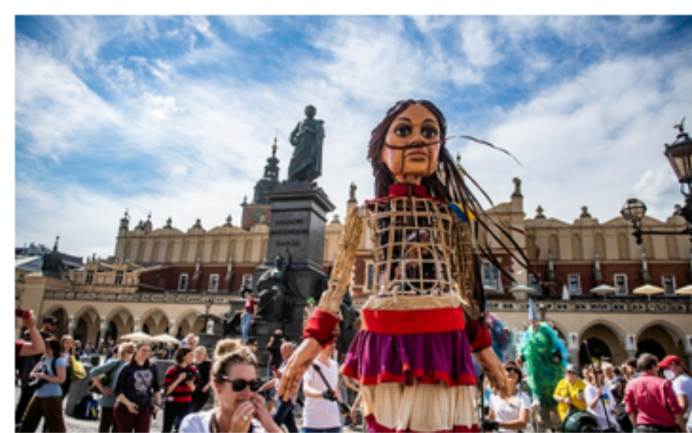
Gigantyczna lalka na ulicach Krakowa. Symbolizuje dzieci dotknięte wojną [ZDJĘCIA]