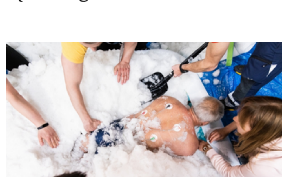
Nowy rekord Guinnessa w najdłuższym przebywaniu pod śniegiem