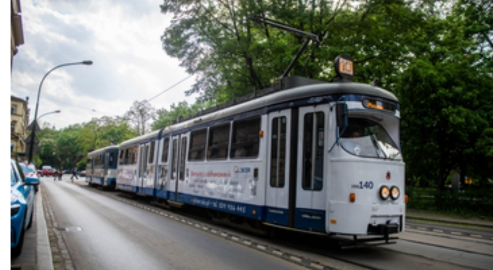
Reklamy znikają z Krakowa. Pozostają jednak inne formy promocji w mieście