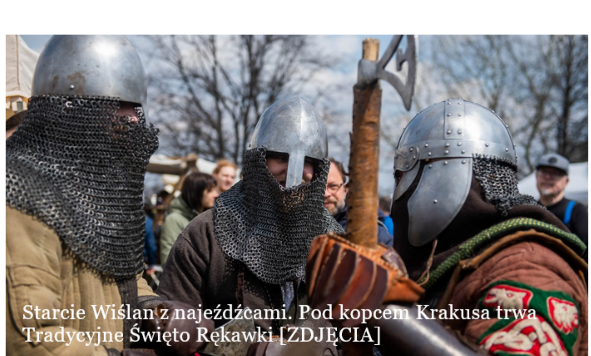
Starcie Wiślan z najeźdźcami. Pod kopcem Krakusa trwa Tradycyjne Święto Rękawki [ZDJĘCIA]

Premiera „Marzeń polskich/Les rêves polonais” już 22 kwietnia o godz. 19.15. Spektakl będzie można zobaczyć również w dniach 23-27 kwietnia oraz 11 i 12 czerwca.