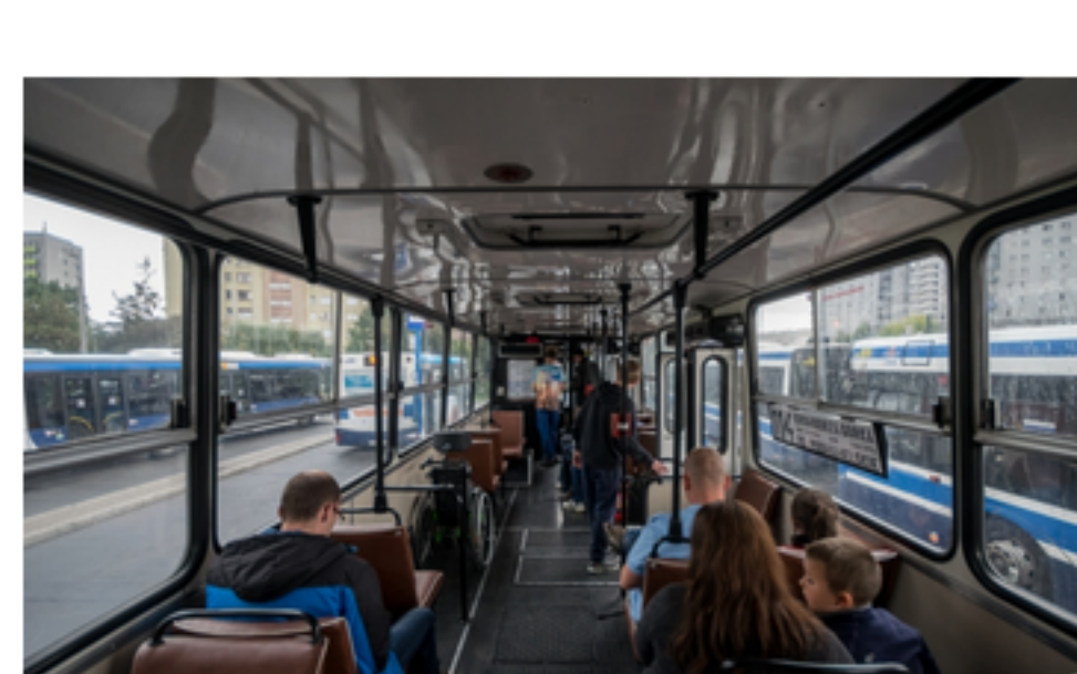
Dziś Noc Muzeów. Więcej kursów i linie z zabytkowym taborem [INFORMATOR]