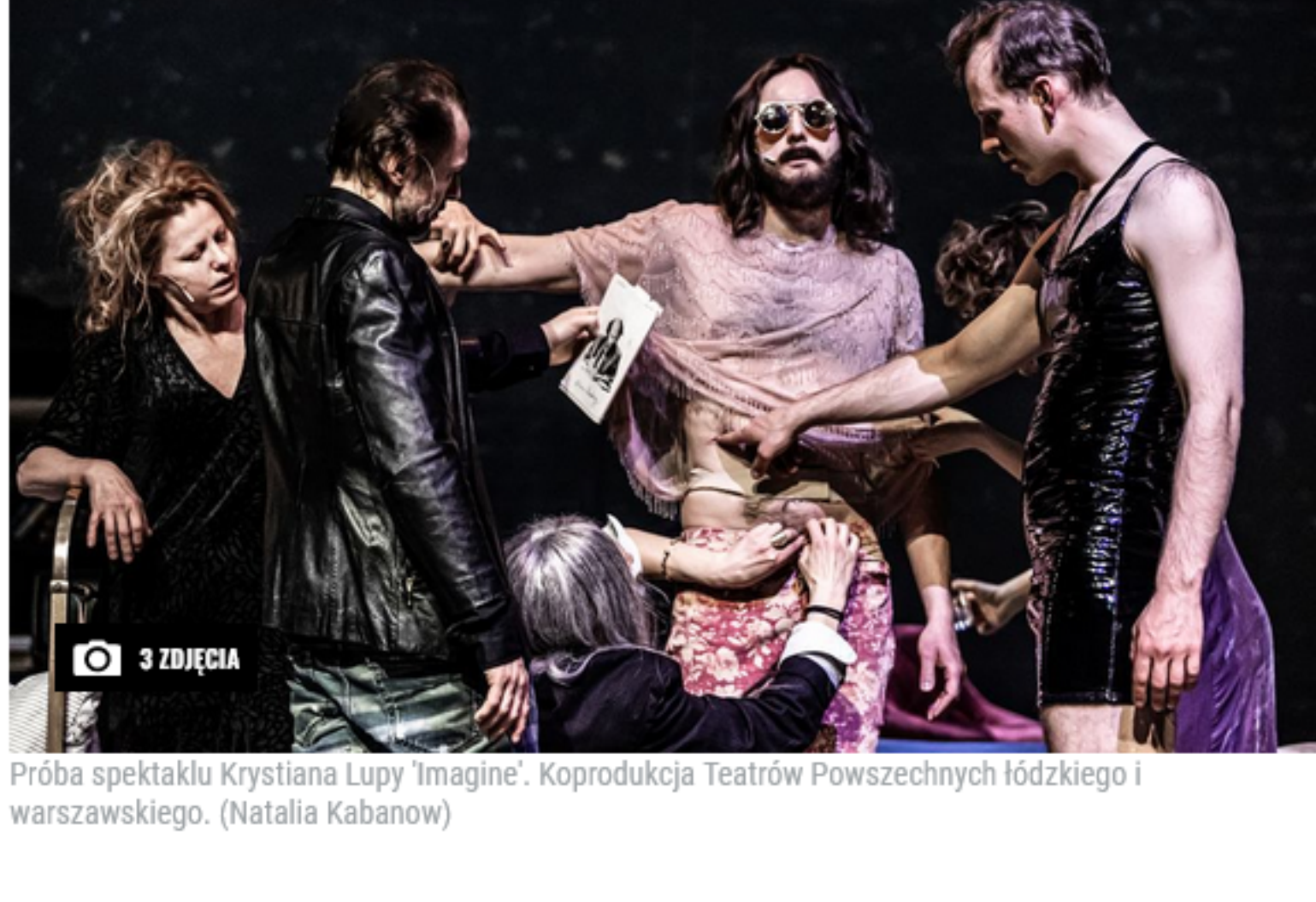
Próba spektaklu Krystiana Lupy 'Imagine'. Koprodukcja Teatrów Powszechnych Łódzkiego i warszawskiego.