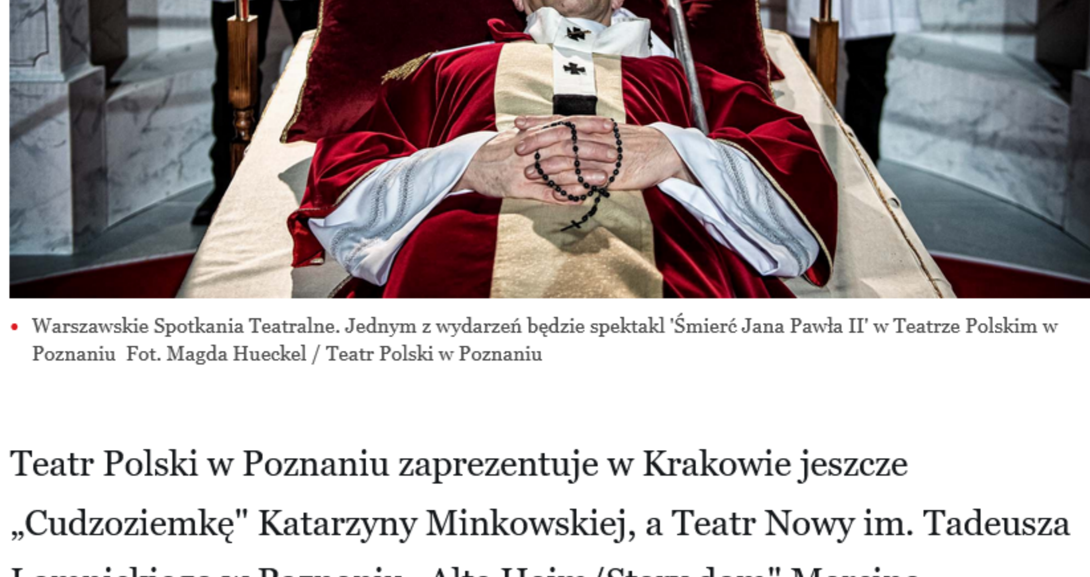
• Warszawskie Spotkania Teatralne. Jednym z wydarzeń będzie spektakl 'Śmierć Jana Pawła II' w Teatrze Polskim w Poznaniu.