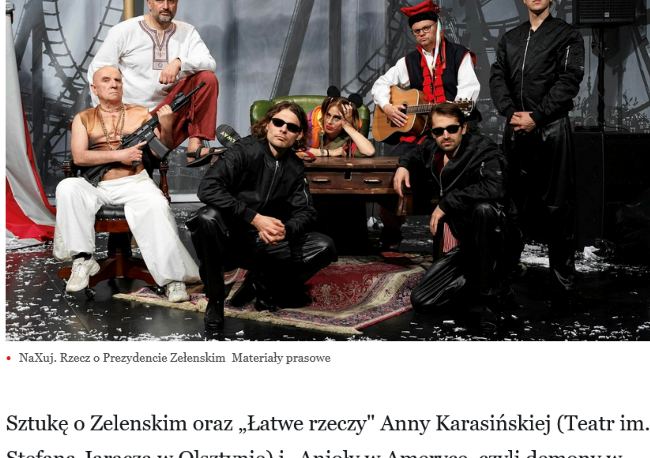
• NaXuj. Rzecz o Prezydencie Zelenskim.

Administratorem danych osobowych podanych przy zapisaniu się na newsletter jest Agora S.A. z siedzibą w Warszawie... Więcej Regulamin Usługi Newsletterów