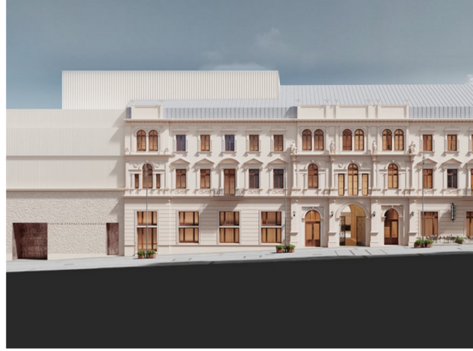
• Teatr im. Żeromskiego w Kielcach. Wizualizacja po przebudowie także dokupionej przy ul. Sienkiewicza 32A

TEATR ŻEROMSKIEGO KIELCE 21.12.2023, 08:52