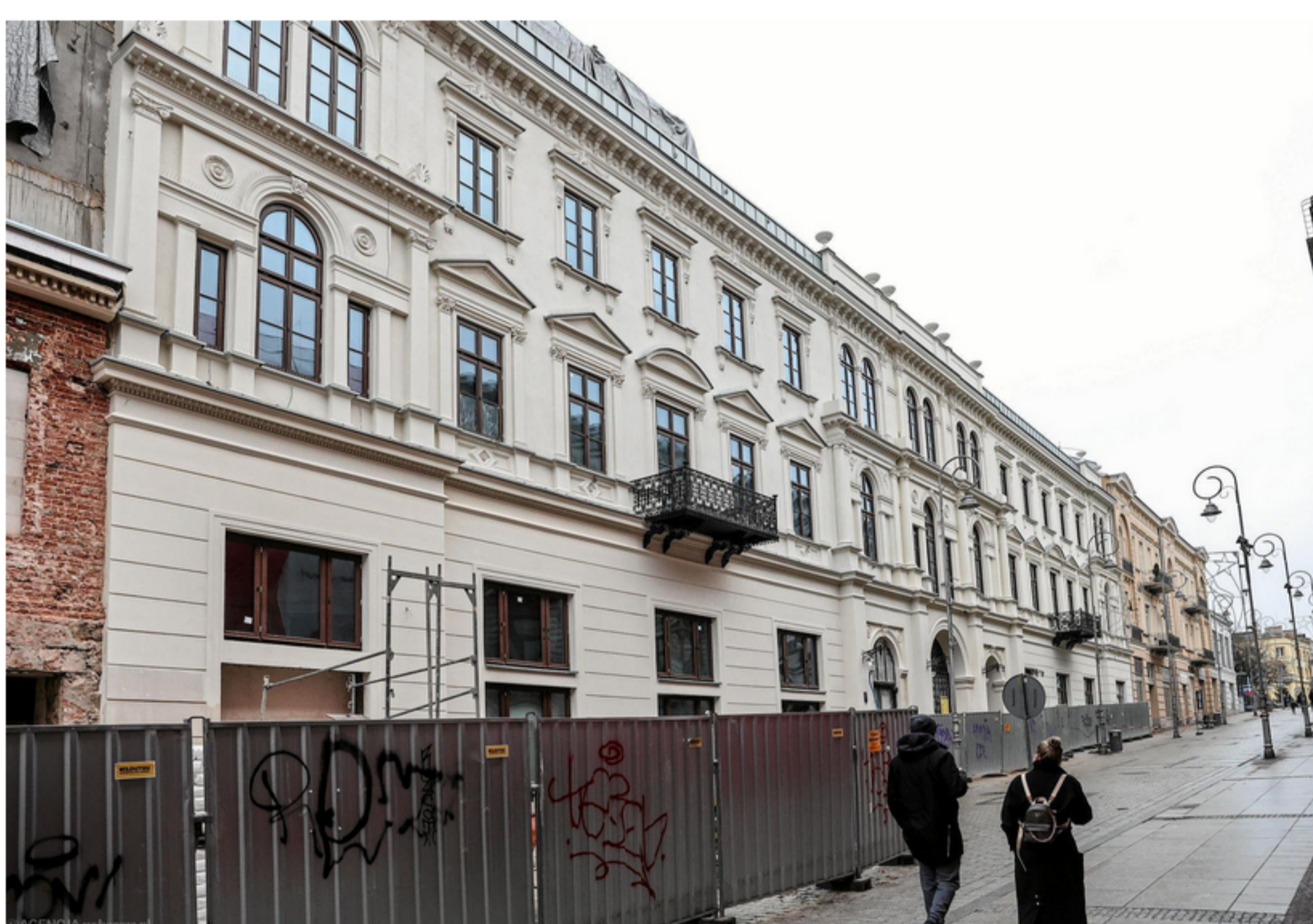
• Kielce 16.12.2023. Budynek Teatru im. Stefana Żeromskiego na finiszu przebudowy