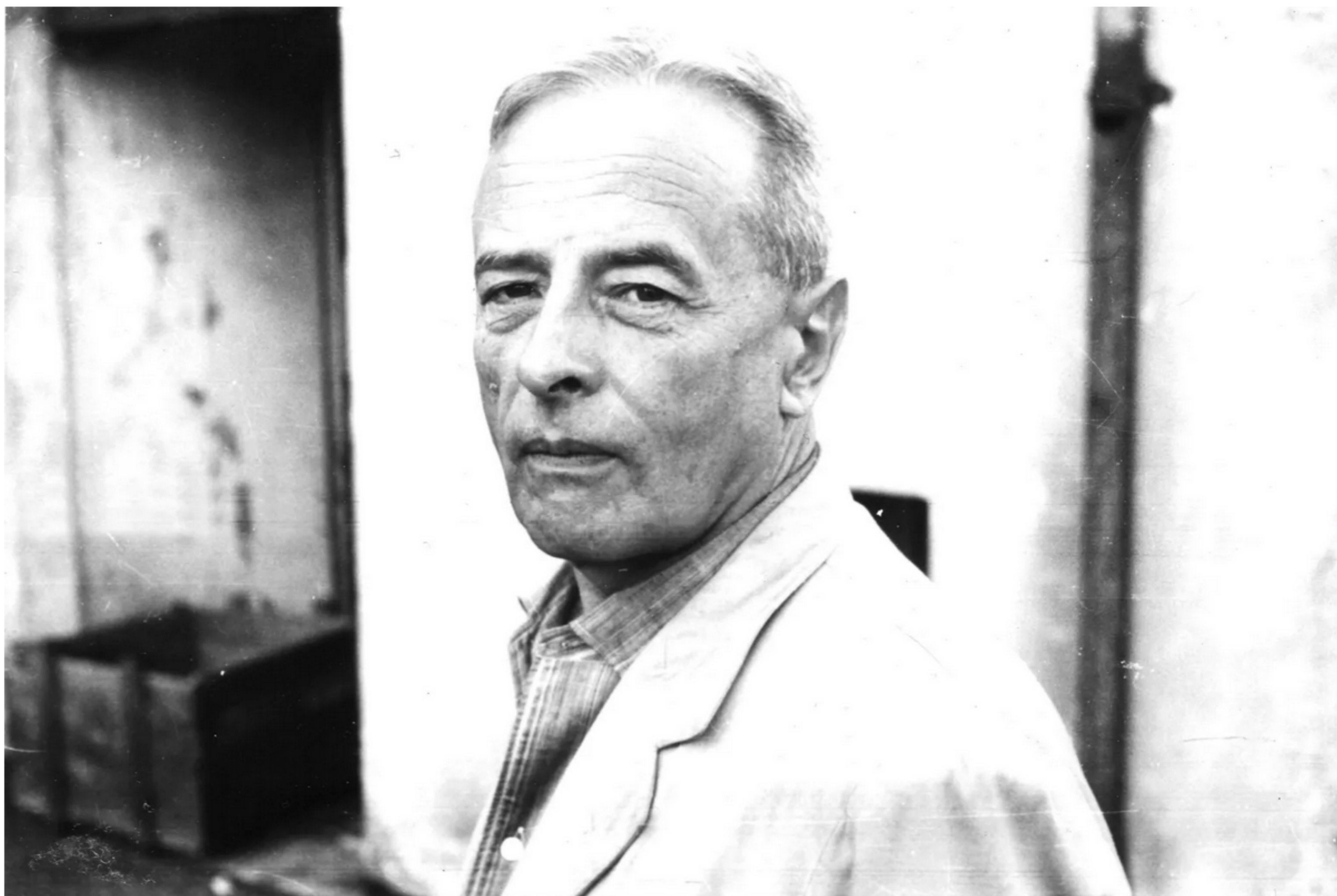
W. Gombrowicz. Buenos Aires, marzec 1963 r.