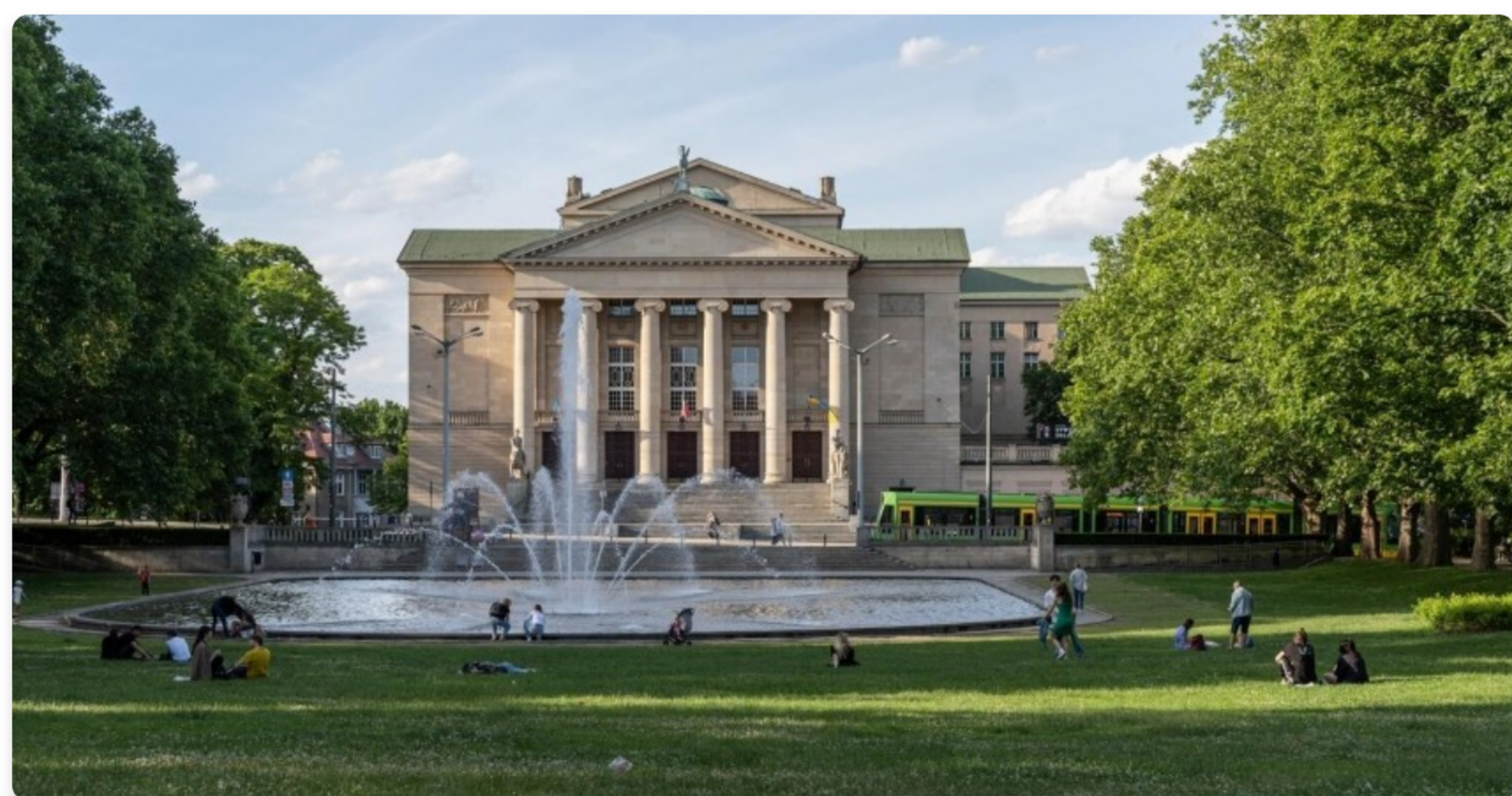
Teatr Wielki w Poznaniu sezonie 2022/23 będzie bez swojej sceny głównej.