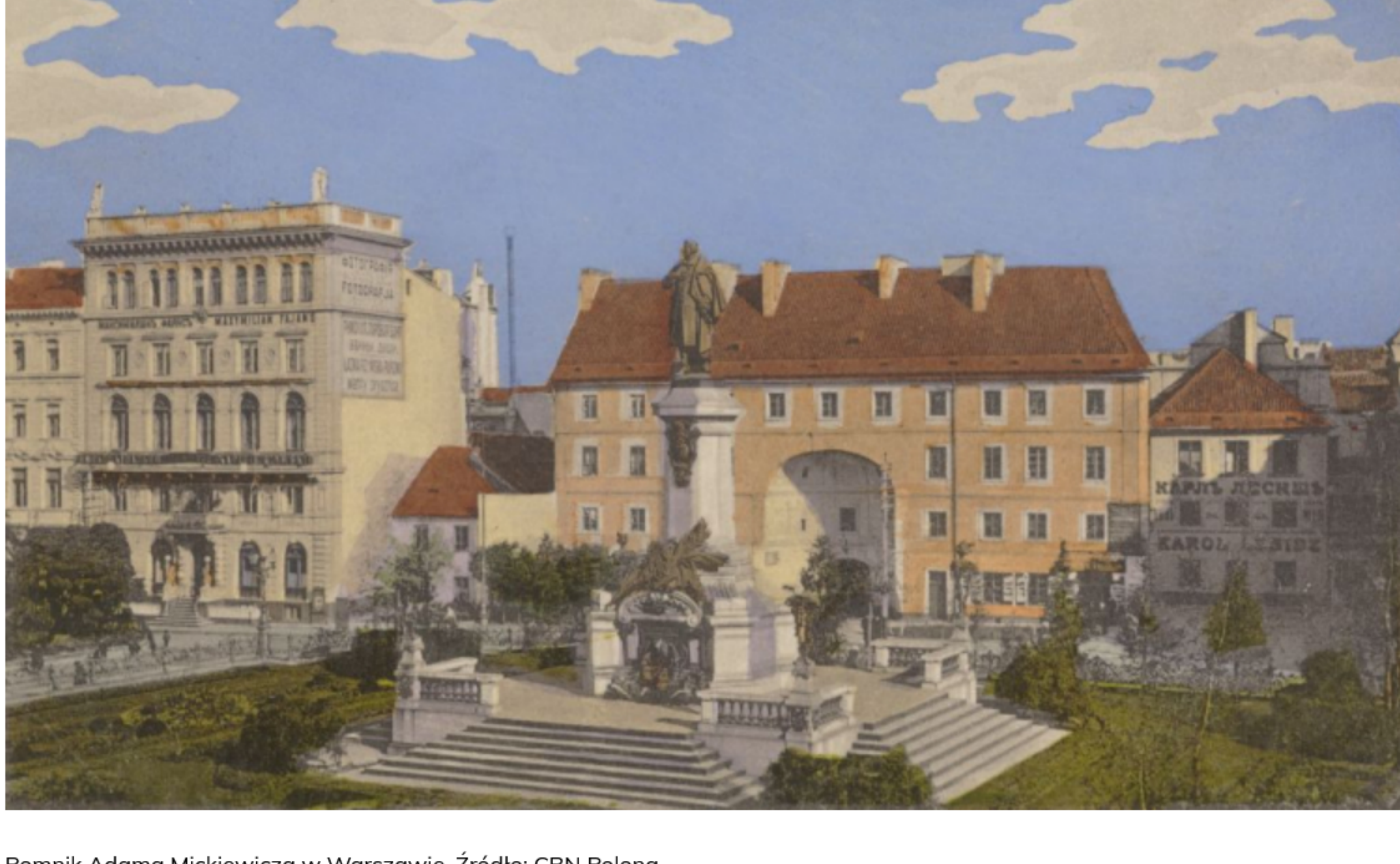
Pomnik Adama Mickiewicza w Warszawie.

AKTUALIZACJA: 25.12.2023, PUBLIKACJA: 24.12.2023 Wiadomości , Artykuły historyczne , Dziedzictwo kulturowe