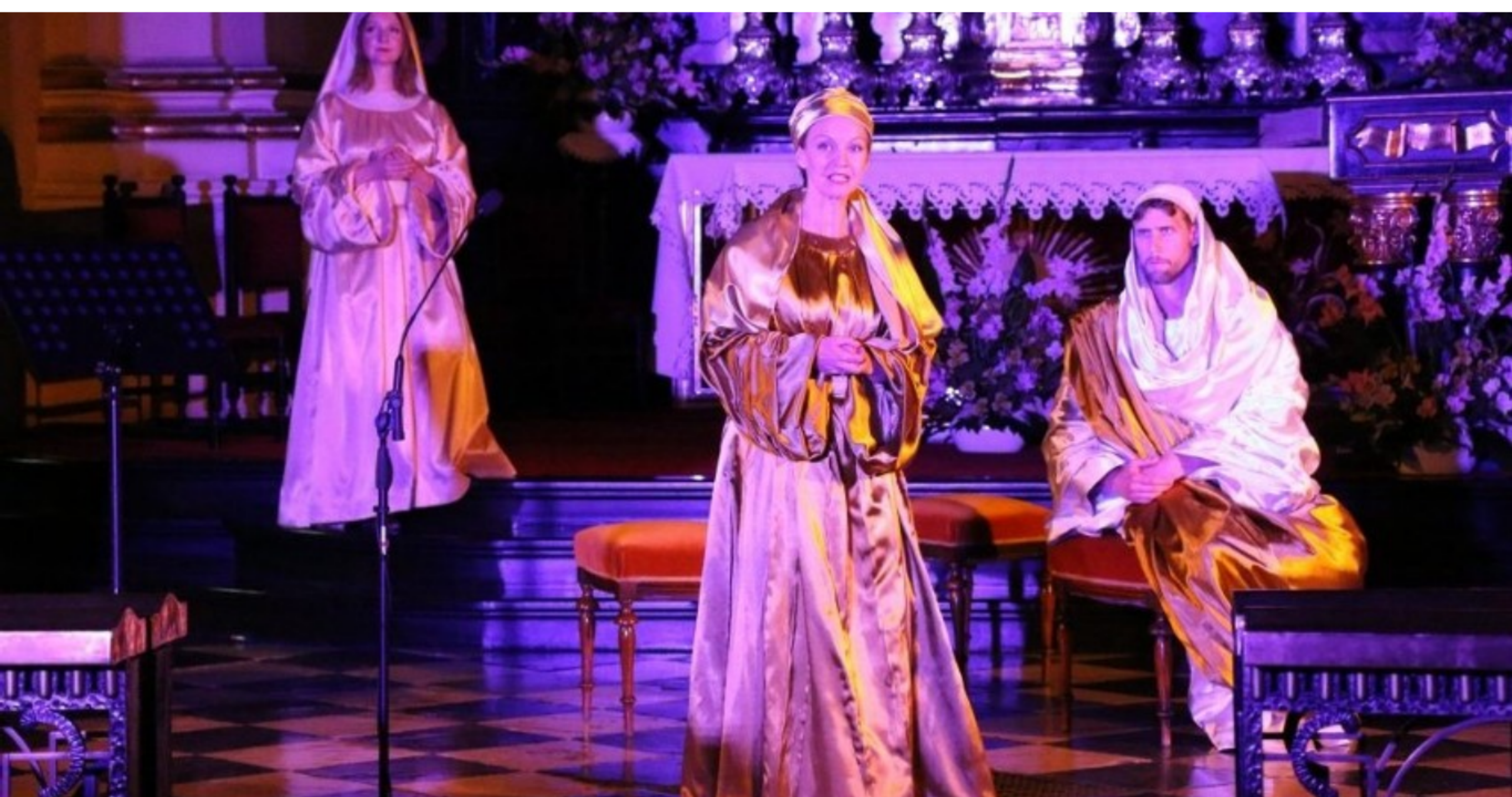
"Pieśń o blasku wody" Karola Wojtyły w wersji Opery Kameralnej w Krakowie