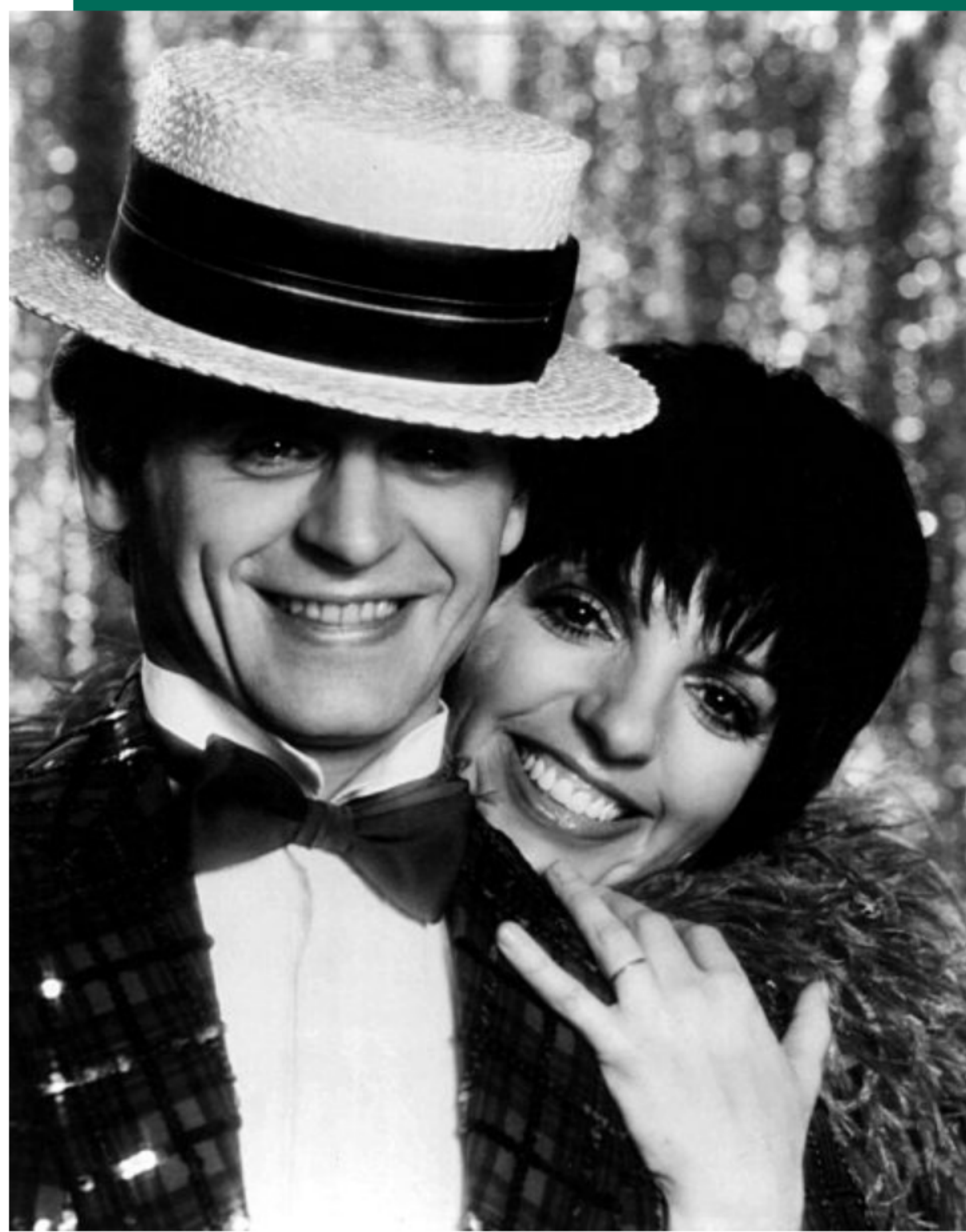
Michail Barysznikow i Liza Minnelli w telewizyjnym pokazie spektaklu „Barysznikow on Broadway”, 1980.