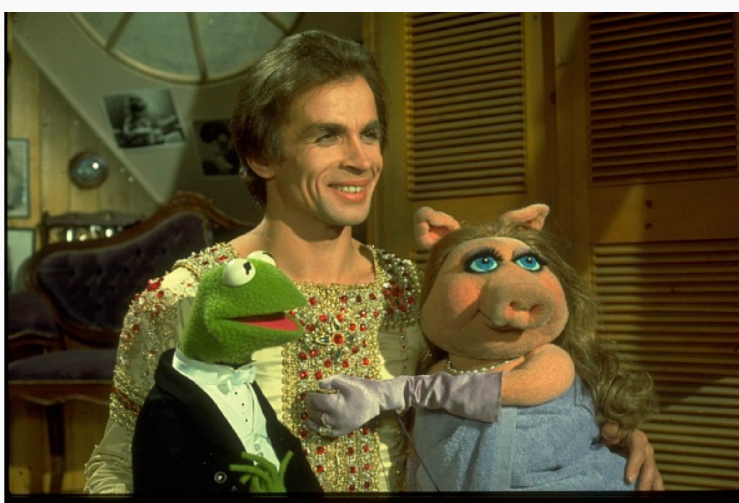
Rudolf Nuriejew z żabą Kermitem (Kermit The Frog) i Panną Piggy (Miss Piggy) na planie „The Muppet Show” w Elstree Studios, Hertfordshire, około 1977 roku.