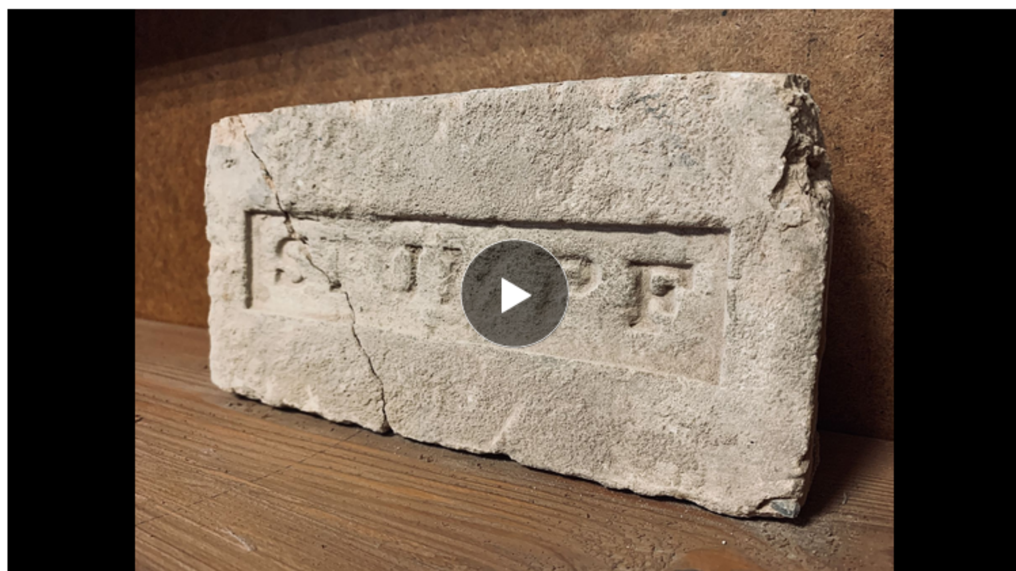
Niezwykłe znalezisko na placu budowy kieleckiego teatru. Cegła z 1877 roku z nazwiskiem fundatora