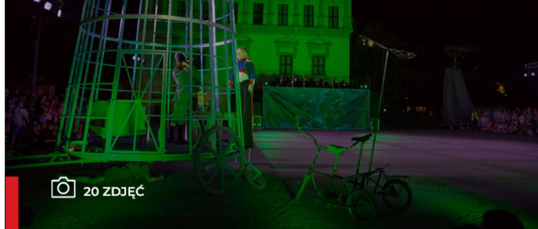
• Perspektywy - 9 Hills Festival 2022 trwał w Chełmnie od 12 do 14 sierpnia

PERSPEKTYWY 9 HILLS FESTIVAL 16.08.2022, 17:09