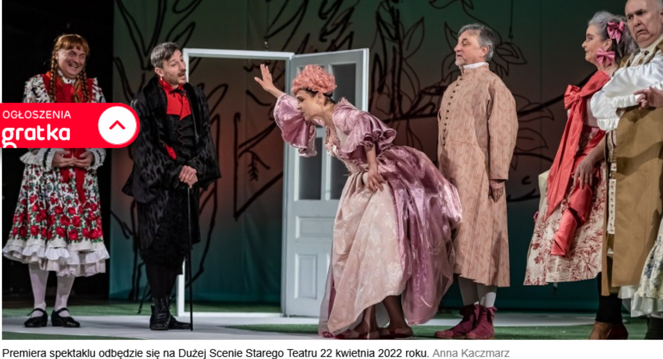
Premiera spektaklu odbędzie się na Dużej Scenie Starego Teatru 22 kwietnia 2022 roku. Anna Kaczmarsz