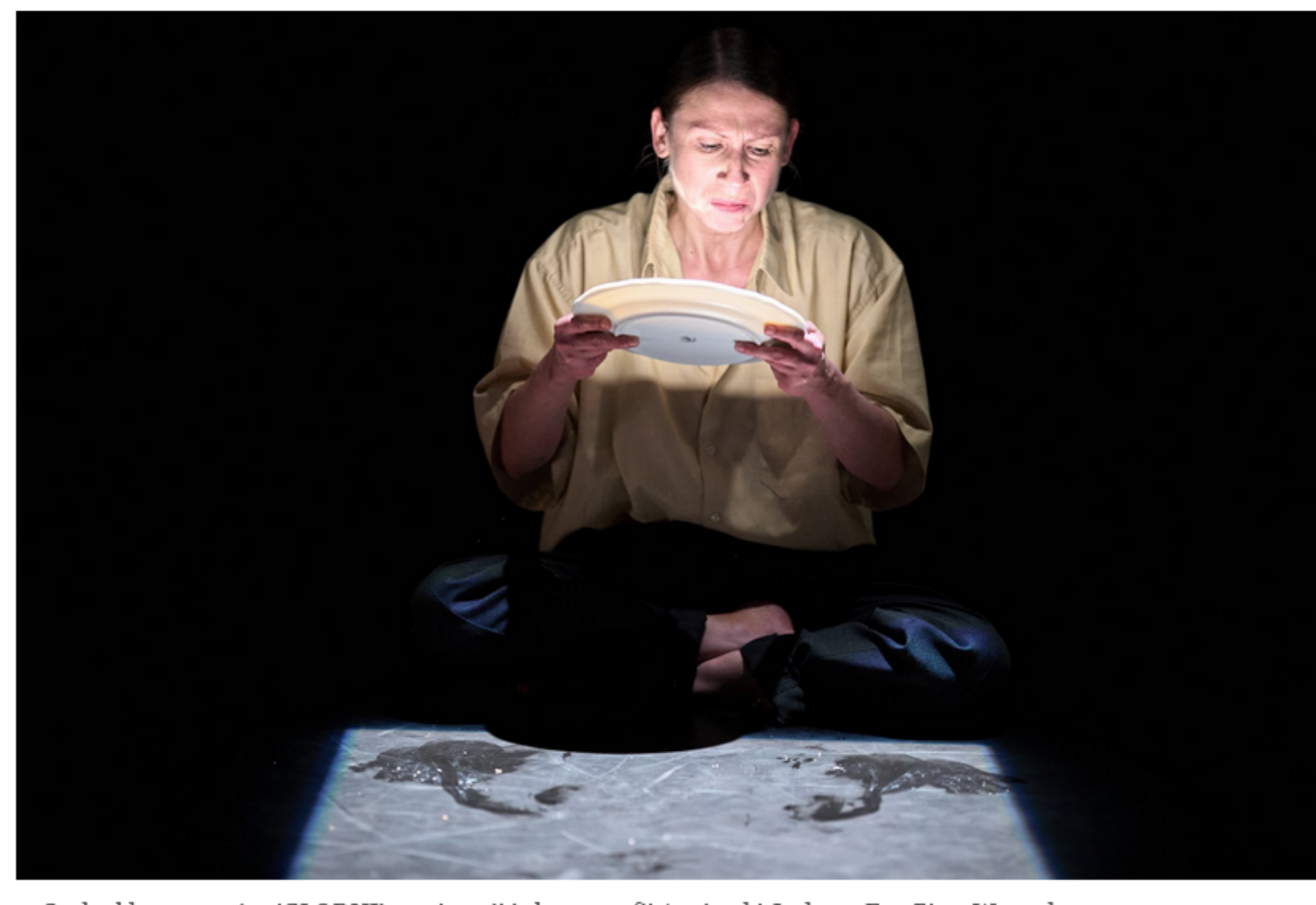
Spektakl teatru tańca 'GŁODNI' w reżyserii i choreografii Agnieszki Jachym

To także spektakl o nas samych. Rozmowa o życiu i decyzjach, które podejmujemy każdego dnia lub na które nie mieliśmy wpływu. Bywa, że wybory te uzależniają nasz rytm codziennego życia od oczekiwania w kolejce po ciepły posiłek, pozbawiają nas dachu nad głową, wykluczają.