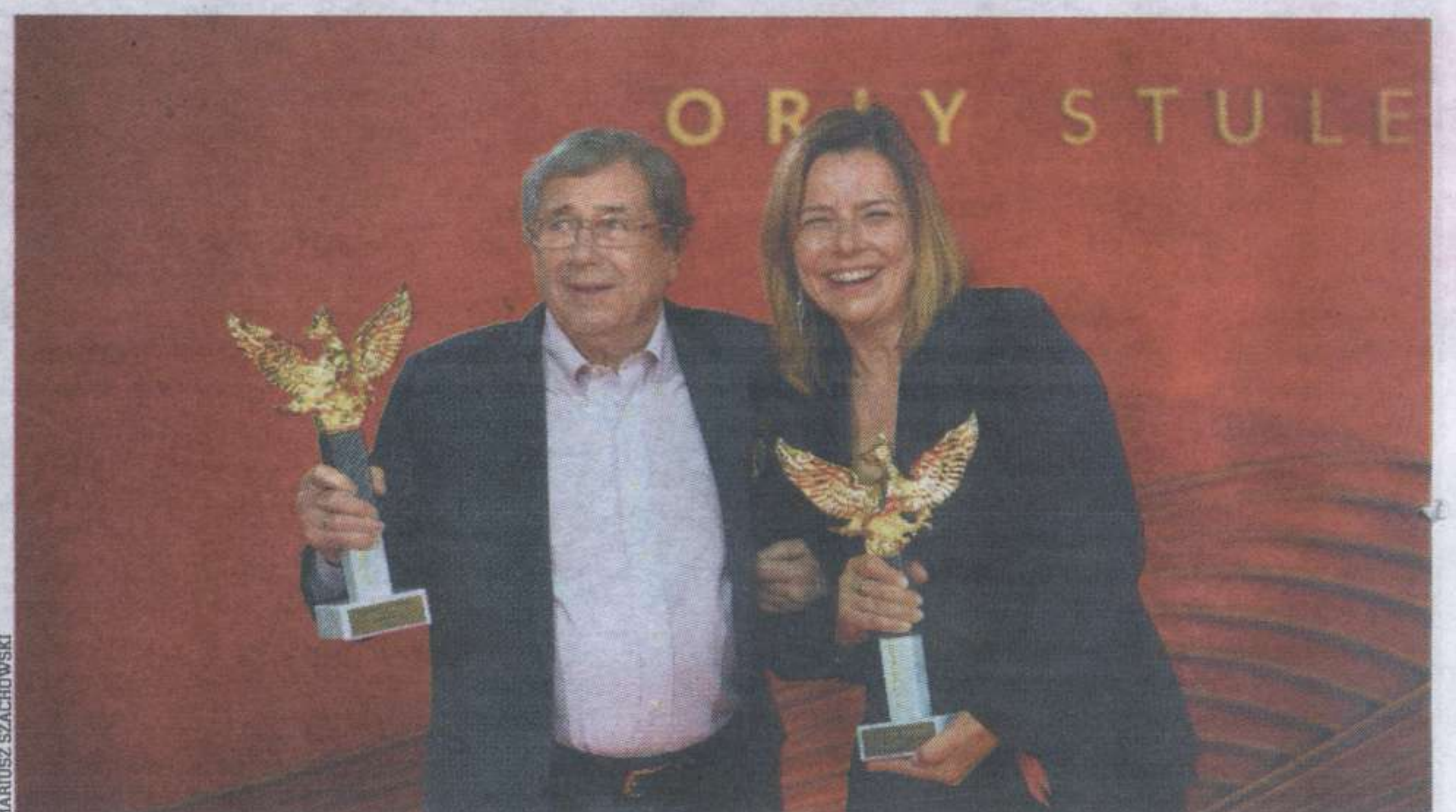
Różne aktorskie pokolenia, ale radość wspólna – Janusz Gajos i Agata Kulesza