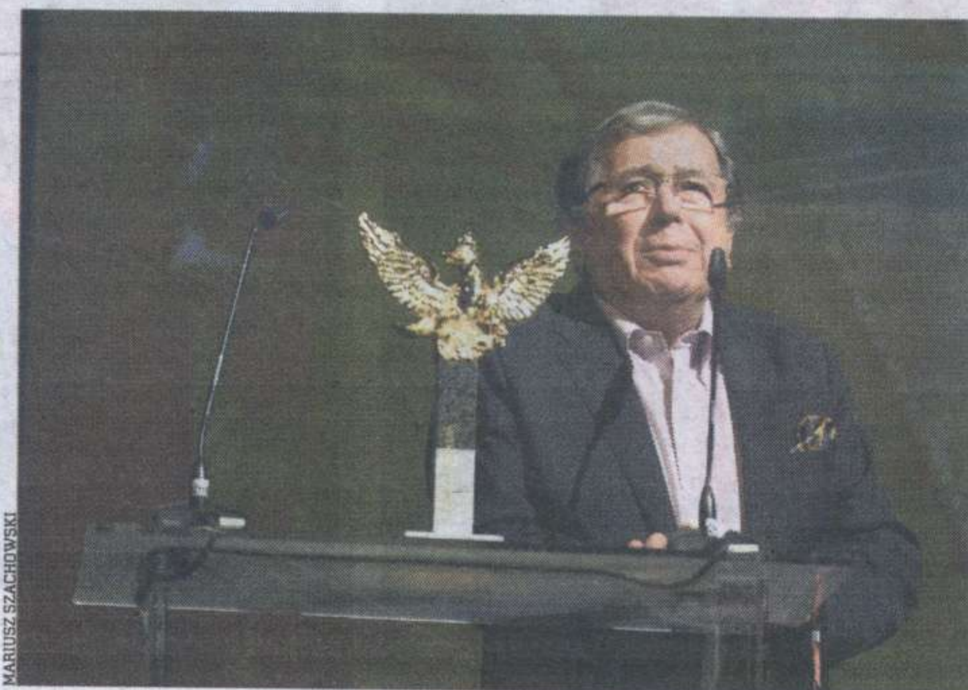
Kategoria FILM I TEATR: JANUSZ GAJOS , aktor teatralny i filmowy. – Trzeba być dzieckiem szczęścia, by świętować stulecie „Rzeczpospolitej” – jednej i drugiej – powiedział na uroczystości