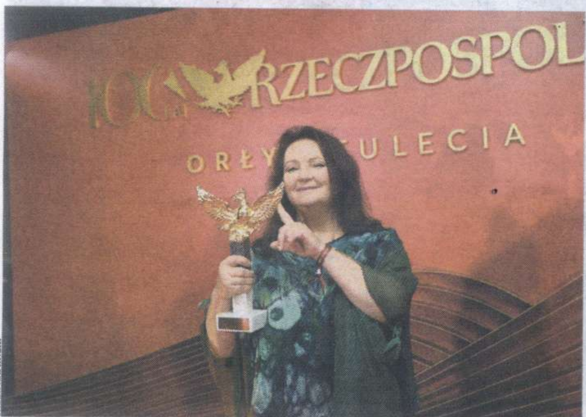
Kategoria DZIAŁALNOŚĆ CHARYTATYWNA: ANNA DYMNA , aktorka, szefowa Fundacji Mimo Wszystko. – Ludzie, którzy cierpią, nauczyli mnie, że człowiek jest największą wartością – wyznała aktorka