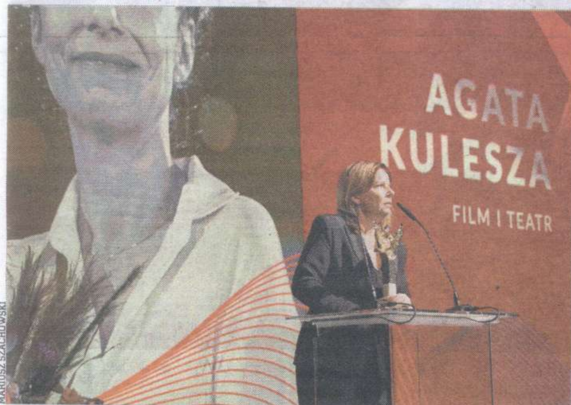
Kategoria FILM I TEATR: AGATA KULESZA , aktorka teatralna i filmowa. – Nagrody mnie mobilizują. Może nie umiem pisać, rzeźbić, ale i tak to robię, by mówić o wrażliwości – podkreślała na gali