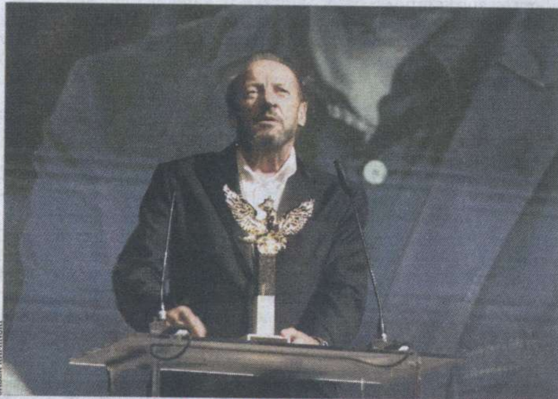
Kategoria MUZYKA: ZBIGNIEW PREISNER , kompozytor, twórca muzyki do filmów m.in. Kieślowskiego, Holland. – Nagroda wręczana jest w Krakowie, a to on mnie ukształtował – podkreślał ze sceny