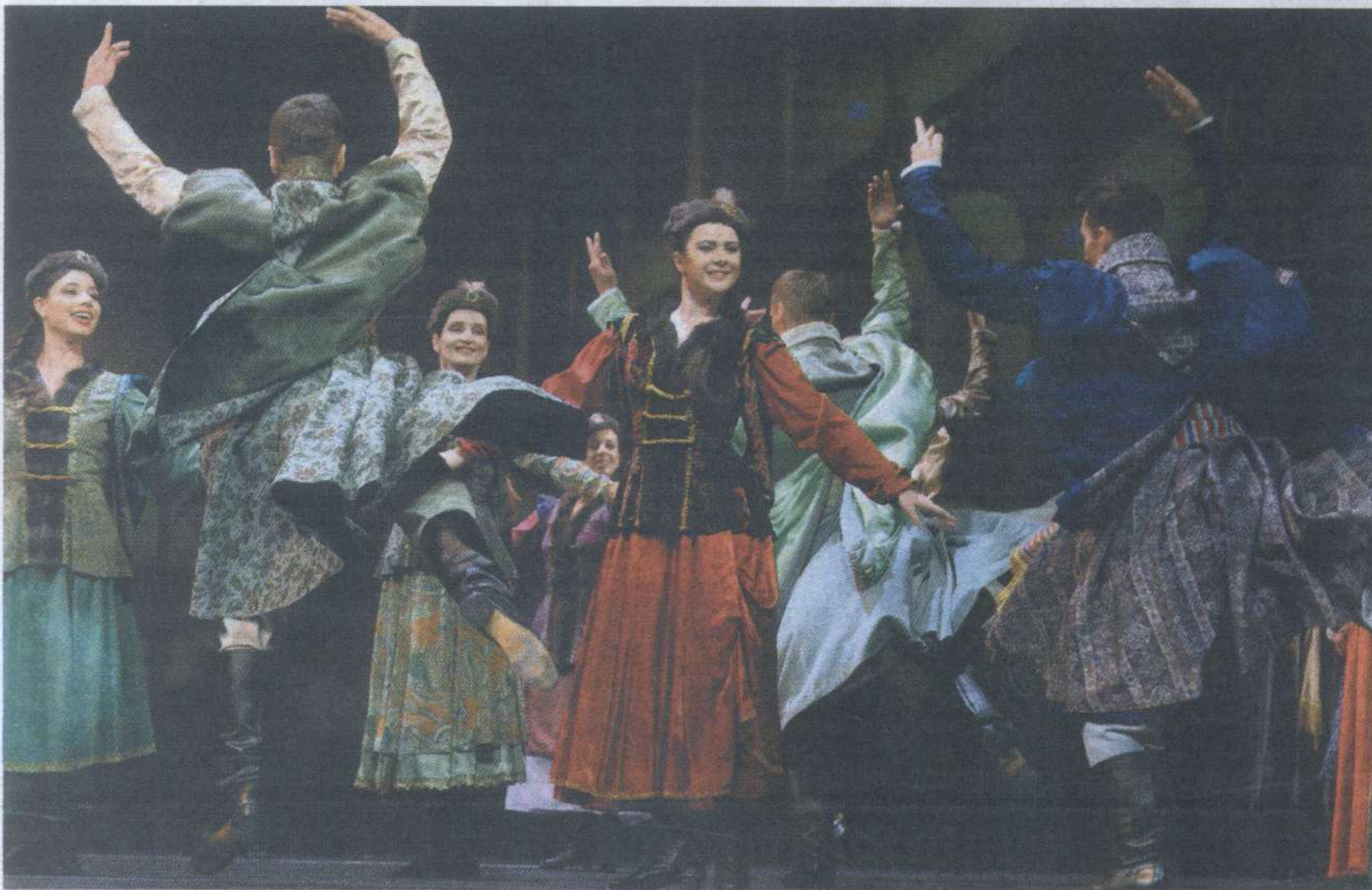
Uroczystość uświetniły fragmenty największych polskich oper