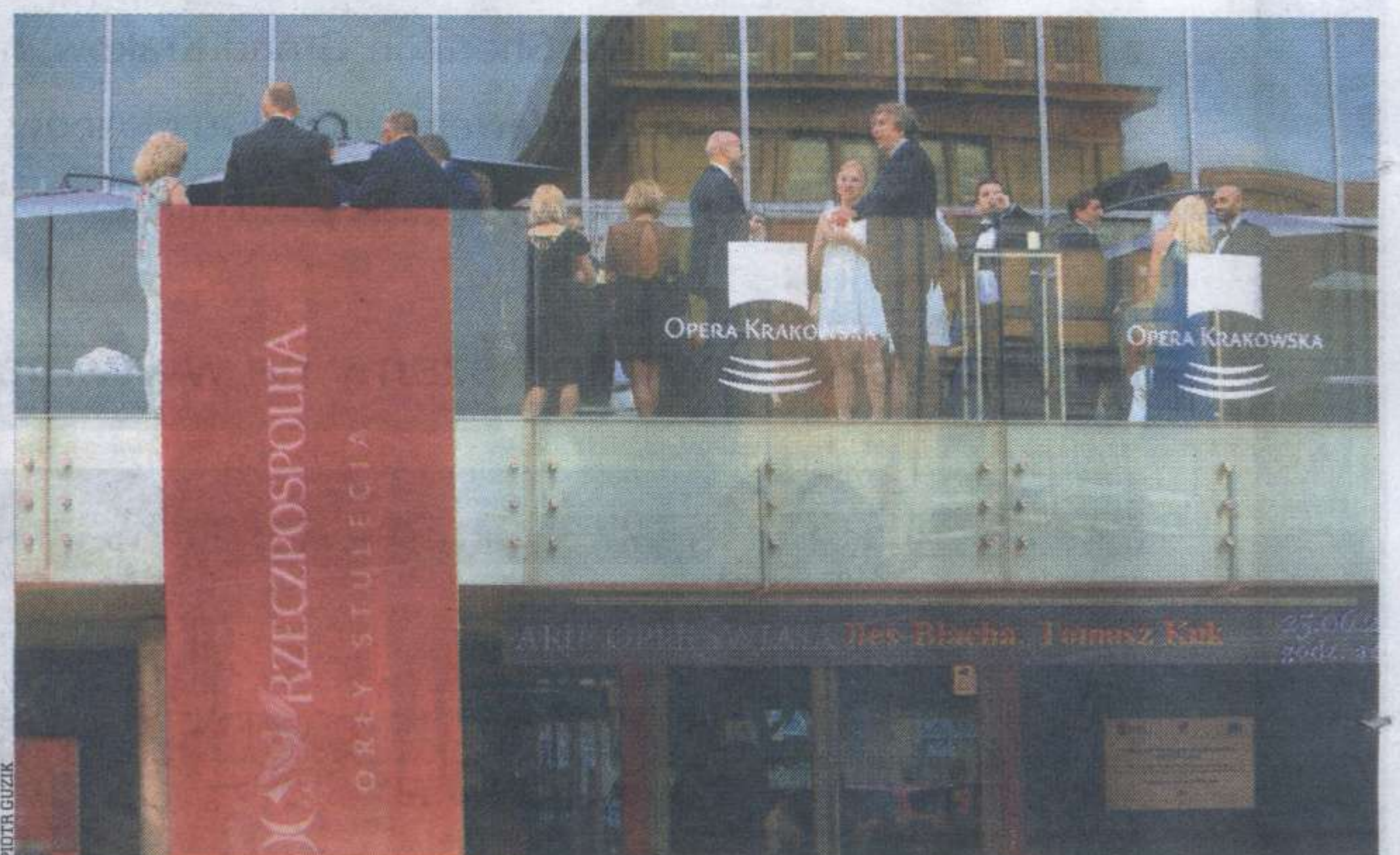
Gospodarzem uroczystości była Opera w Krakowie