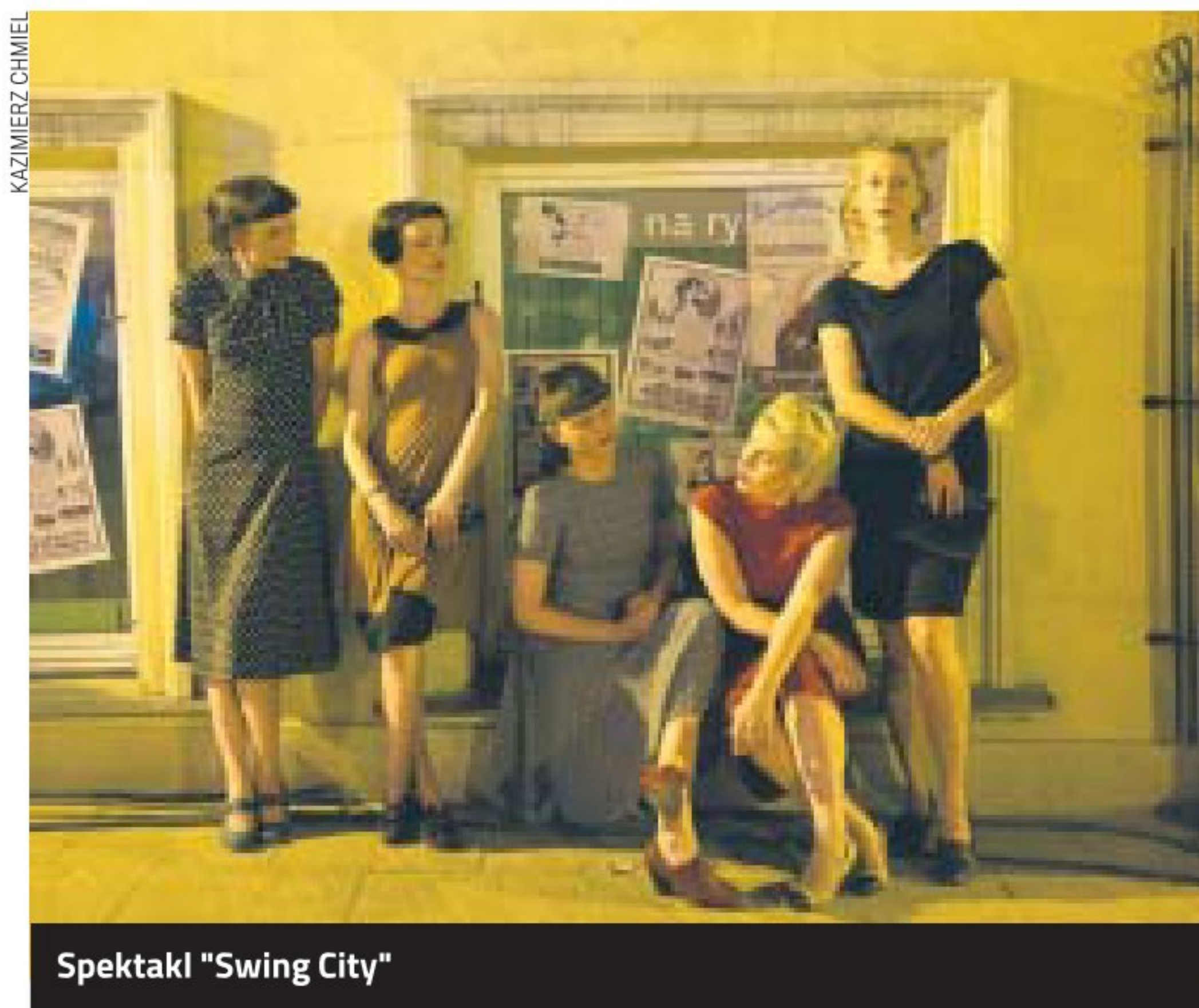
Spektakl "Swing City"