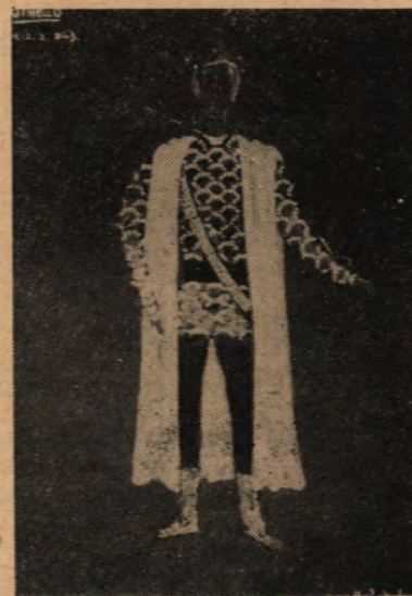
Projekt kostiumu Otella