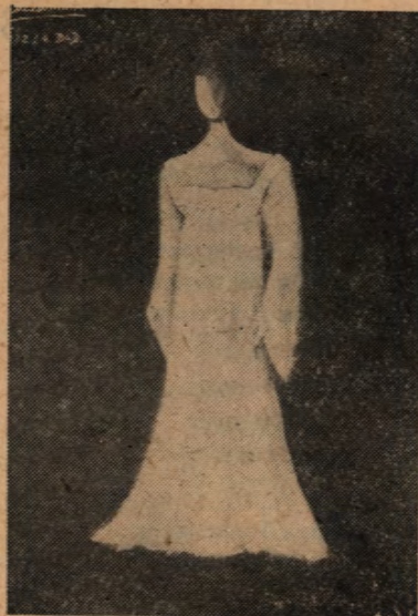
Projekt kostiumu Desdemony