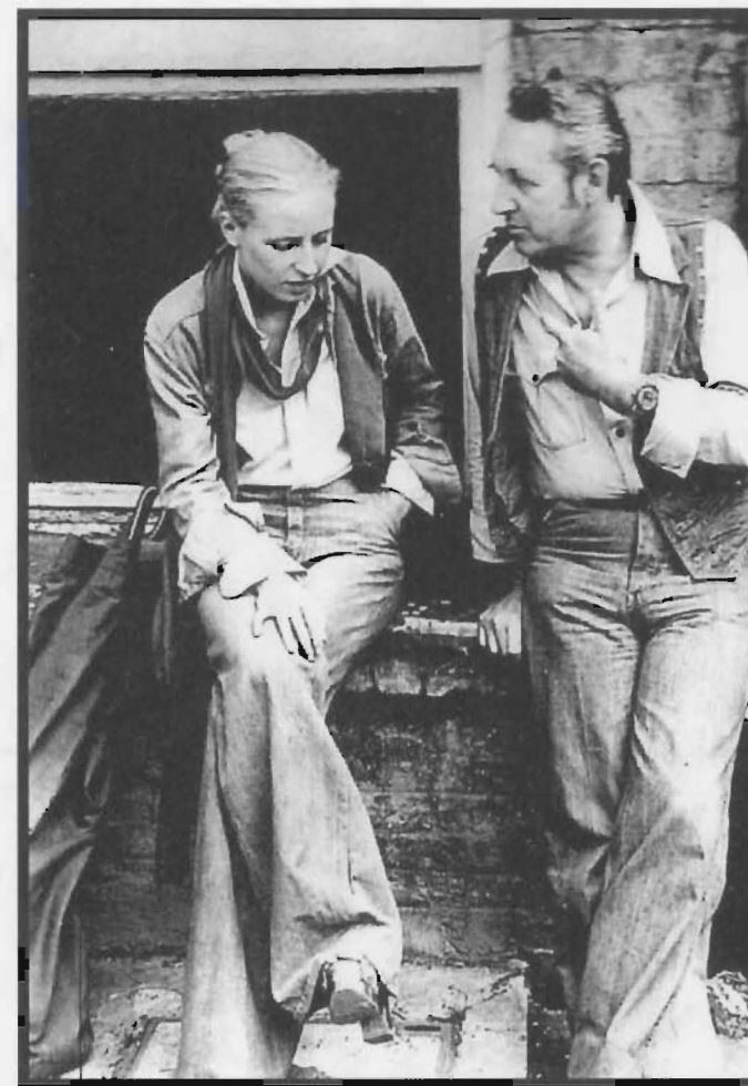
Krystyna Janda oraz Andrzej Wajda

1985 początek pieriestrojki – procesu przekształceń systemu komunistycznego w ZSRR w latach 1985–1991 – której inicjatorem był Michaił Gorbaczow, sekretarz generalny KC KPZR.