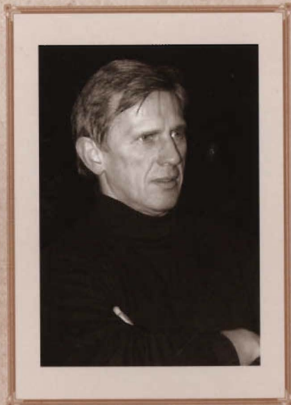
Jan Englert - aktor, reżyser, pedagog (od 1987 rektor Akademii Teatralnej w Warszawie).