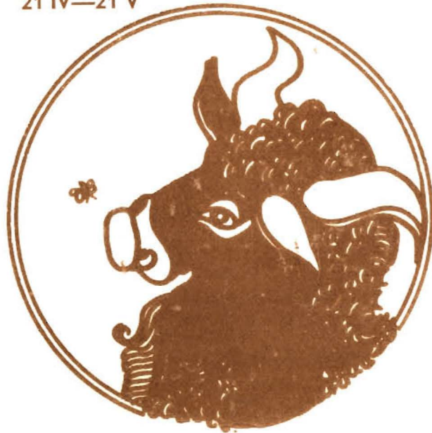
BYK 21 IV—21 V