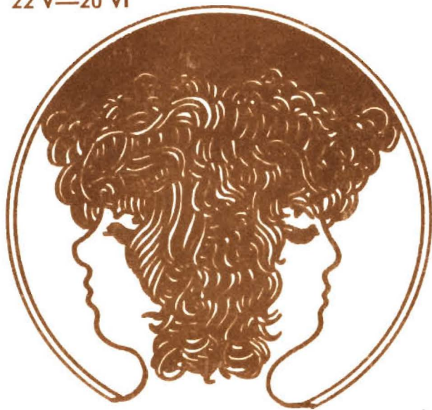
BLIŹNIĘTA 22 V—20 VI