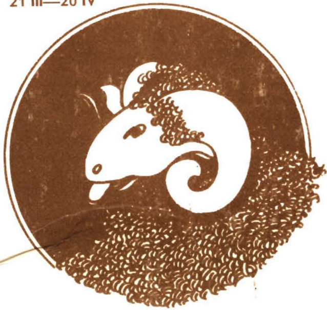
BARAN 21 III—20 IV