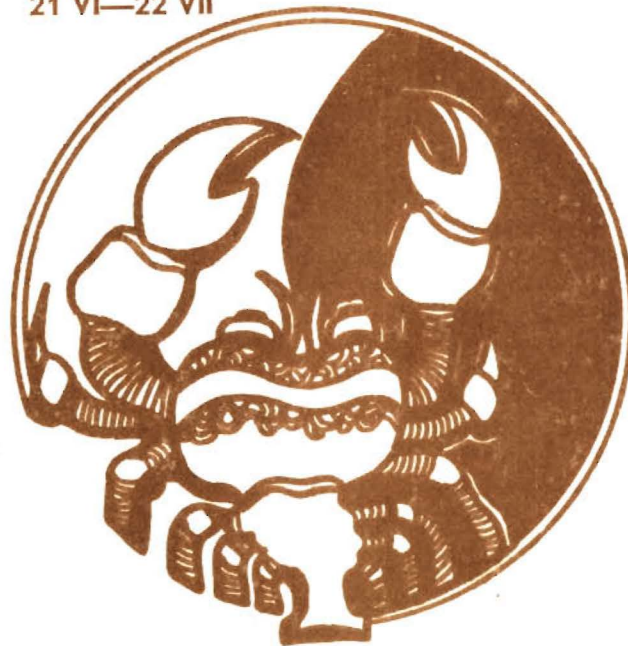
RAK 21 VI—22 VII