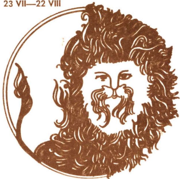
LEW 23 VII—22 VIII