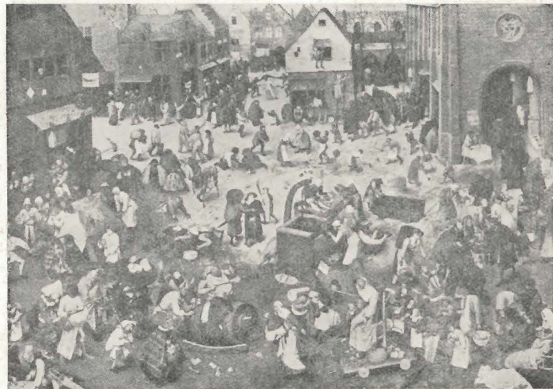
P. Breughel — walka Karnawału z Postem

W Średniowieczu forma i treść najbardziej dla feudalizmu reprezentacyjnych widowisk teatralnych były zasadniczo różne od zawartości i kształtu przedstawień w teatrze antycznym. Jednak Średniowiecze zachowało plenerowość i doprowadziło do kolosalnych rozmiarów rys „masowości” teatru. Rozmach średniowiecznych przedsięwzięć teatralnych ilustrują protokolarne opisy spektakli misteryjnych: Wiadomość o mającym odbyć się widowisku teatralnym elektryzowała całe miasto; w przygotowaniach uroczystości brała udział większość obywateli średniowiecznego grodu; nie szczędzili oni pieniędzy i czasu pracy dla najokazalszej prezentacji tekstu, który liczył nieraz 50 i więcej tysięcy wierszy, którego inscenizacja w poszczególnych wypadkach trwała 25 dni z rzędu i wymagała zatrudnienia ponad 500 aktorów.