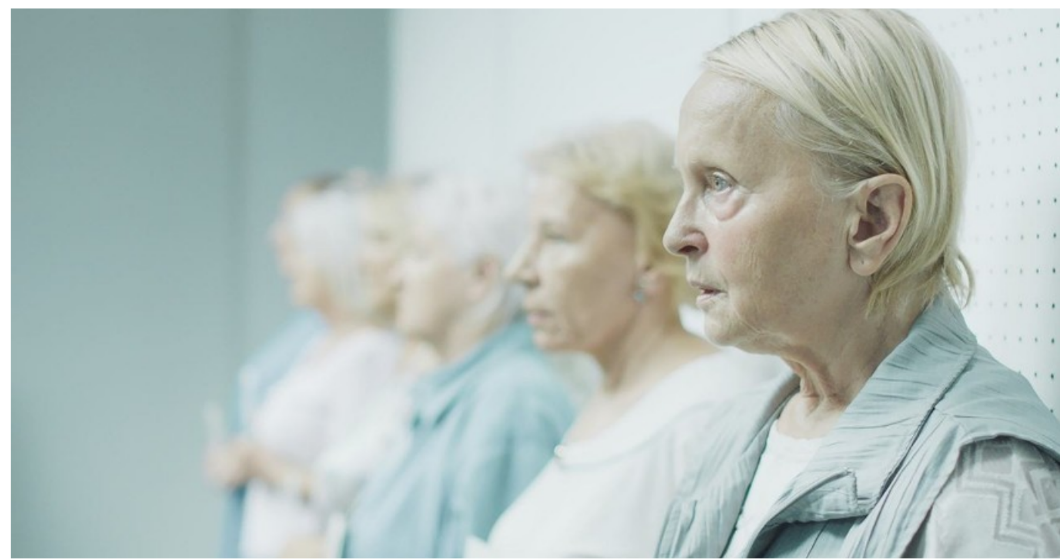
Dorota Pomykała jako Mira w "Kobiecie na dachu" Kadr z filmu "Kobieta na dachu"