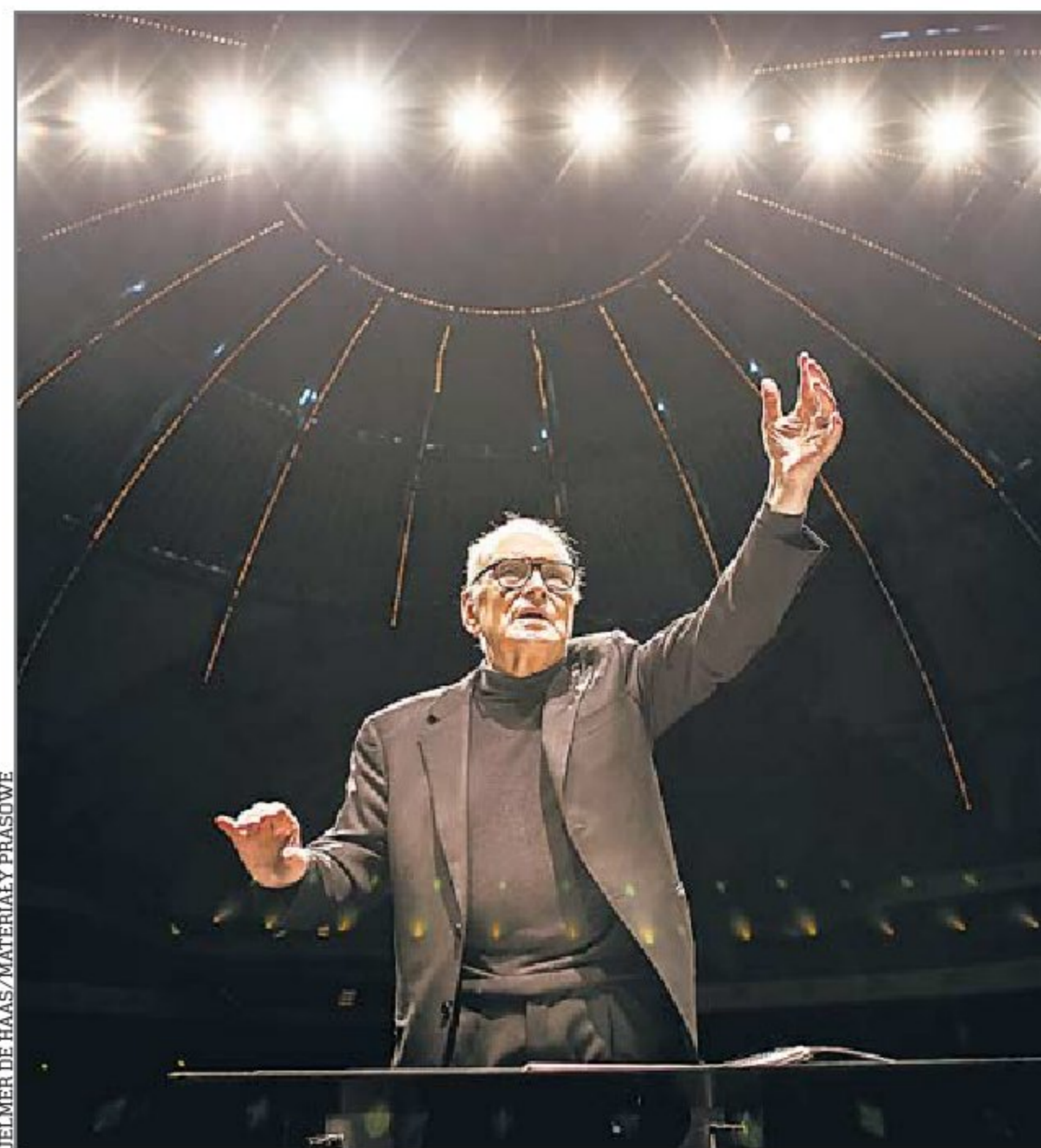
◆ Koncert Ennio Morricone zaplanowano w Hali Stulecia na 23 lutego

Nie ma szans na powrót Pink Floyd, ponieważ pianista Richard Wright nie żyje. Albumem „Endless River” David Gilmour zakończył działalność supergrupy. Ale wykonuje jej kompozycje na solowych