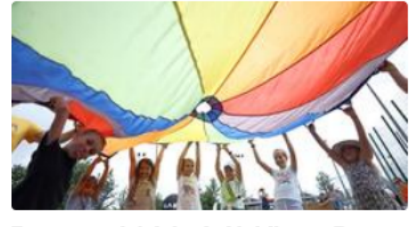
Zaproponuj działania Mobilnego Domu Kultury GAK