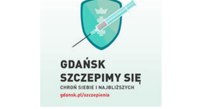
GDANSK SZCZEPIMY SIĘ CHROŃ SIEBIE I NAJBLIŻSZYCH gdansk.pl/szczepienia