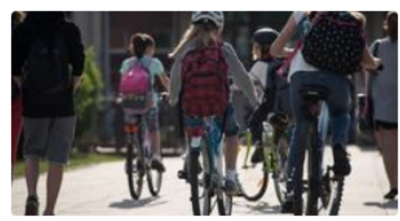
Rowerowy Maj – zabawa promująca zdrowie i aktywność potrwa do końca miesiąca