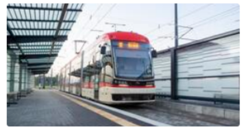
Linie 2, 3, 4, 6, 9 i 12: przystanek „Uniwersytet Medyczny” 02 tymczasowo nieczynny