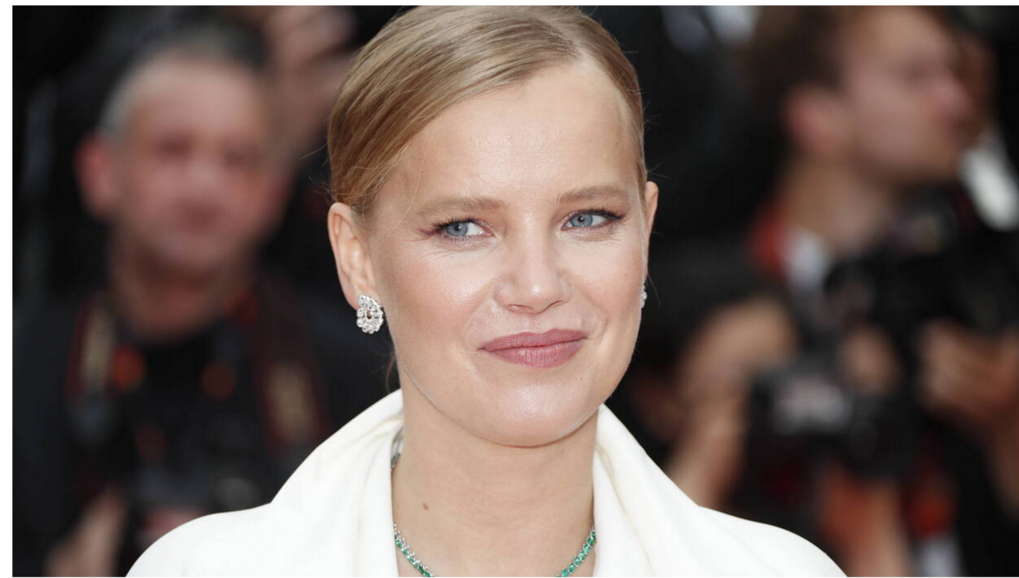
Joanna Kulig.