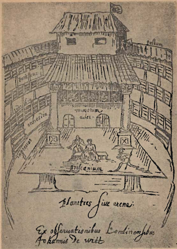
WNĘTRZE TEATRU „POD ŁĄBĘZIEM”.

NIE RUSZYSZ SIĘ STĄD, AŻ CI POSTAWIĘ ZWIERCADŁO, W KTÓRYM ZOBACZYSZ NAJTAJEMNIEJSZĄ GŁĄB DUSZY WŁASNEJ.