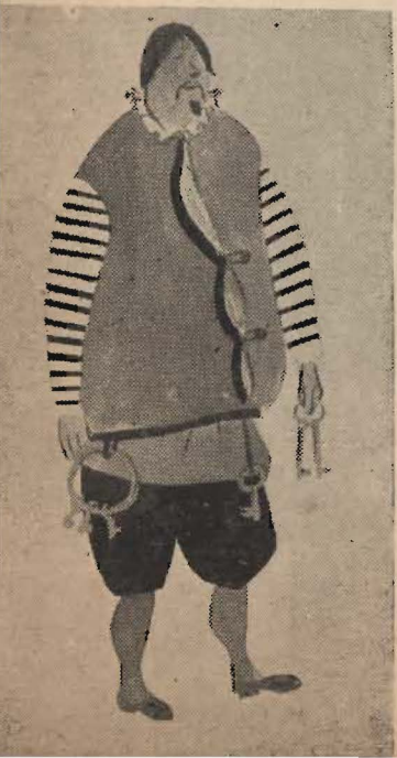
PROJEKTY KOSTIUMÓW TADEUSZA KANTORA.